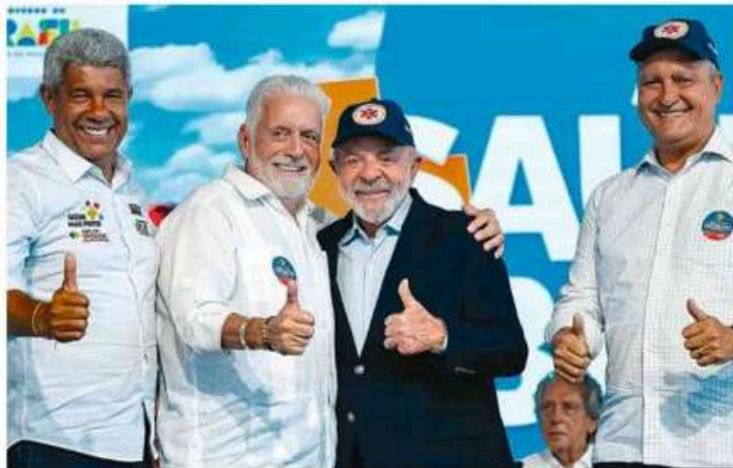
O governador Jerônimo Rodrigues, Jaques Wagner, Lula e Rui Costa em cerimônia em Salvador