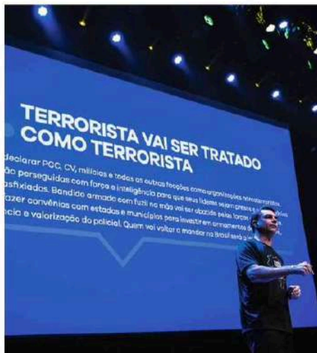
O senador Flávio Bolsonaro (PL-RJ) discursa durante evento em São Paulo em que apresentou propostas para a segurança.

O pré-candidato à Presidência pelo PL subiu ao palco acompa-