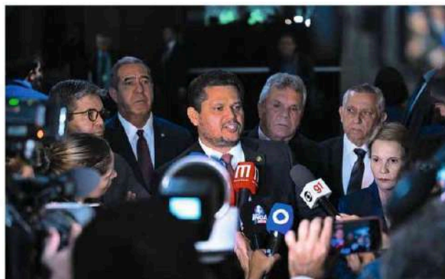
Senador Davi Alcolumbre (União Brasil-AP) defende Jaques Wagner (PT-BA) ao lado dos senadores Randolfe Rodrigues (PT-AP, 1º da esq. para a dir.), Izalci Lucas (PL-DF, 5º) e Tereza Cristina (PP-MS, 6º) e dos deputados Luiz Gastão (PSD-CE, 2º) e Alberto Fraga (PL-DF, 4º)

Nos bastidores, o presidente do Senado queria evitar que a sessão se transformasse num palco de acusação e defesa do senador petista. Em declaração à imprensa, ele criticou a polari-