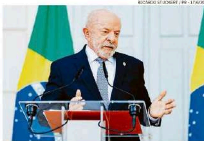
Lula acompanhou, no Palácio da Alvorada, a entrevista do aliado

dor ontem para lhe prestar solidariedade, mas pediu que ele se defendesse em público e esclarecesse as acusações o mais rápido possível.