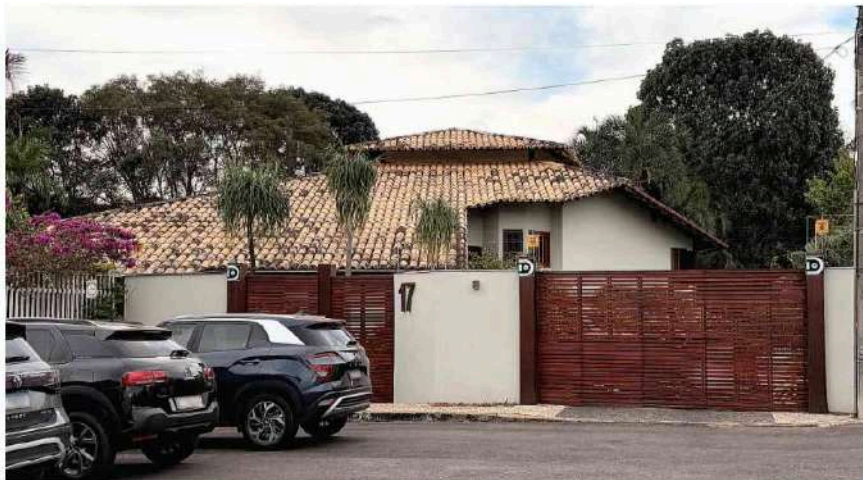
Casa no Lago Sul, em Brasília, que vai servir de QG da campanha à reeleição do presidente Lula.