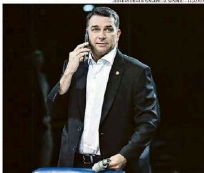
Flávio cita na ação o impacto das falas de Lula nas redes sociais

A ação não é eleitoral e se dá no contexto bélico da disputa. Este ano, a campanha já se transformou em uma corrida