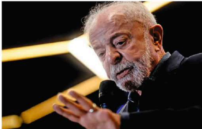
O presidente Lula (PT) discursa durante visita ao Observatório Regional Amazônico.