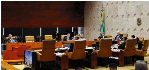
Ministros debatem durante sessão plenária do Supremo Tribunal Federal. Victor Pimentel - 28.mai.25/Divulgação STF