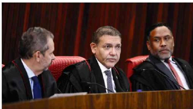
O presidente do TSE, ministro Kassio Nunes Marques, durante sessão da corte

Estela Aranha pede mais tempo para analisar caso após Kassio Nunes Marques votar por manter suspensão de divulgação do levantamento