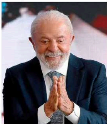
Lula anuncia benefícios a servidores públicos no Palácio do Planalto.