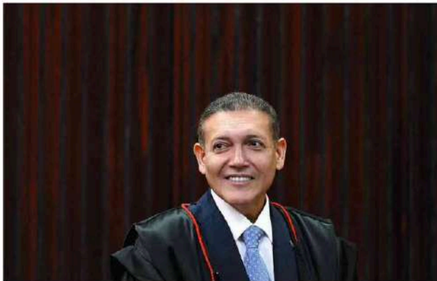
O ministro Kassio Nunes Marques assume a presidência do TSE.