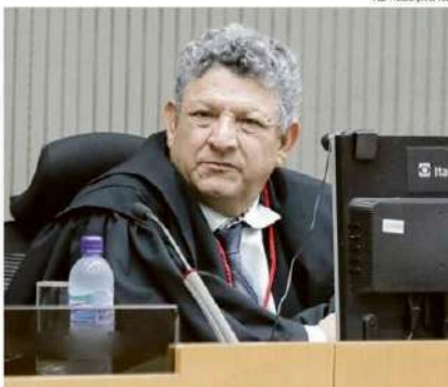
Dirceu dos Santos teve variação patrimonial incompatível, diz apuração

Em março, Dirceu dos Santos foi afastado das funções após investigações apontarem que o magistrado operava em seu gabinete um esquema de venda de sentenças com o auxílio de empresários e advogados. Na ocasião, a Corregedoria Nacional de Justiça, junto com a PF, realizou buscas na sede do TJ de Mato Grosso.