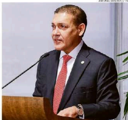
Para Nunes Marques, pesquisa gera 'suspeitas de indução ao eleitor'