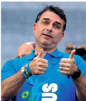
Flávio Bolsonaro saúda fiéis durante a Marcha por Jesus, em São Paulo.