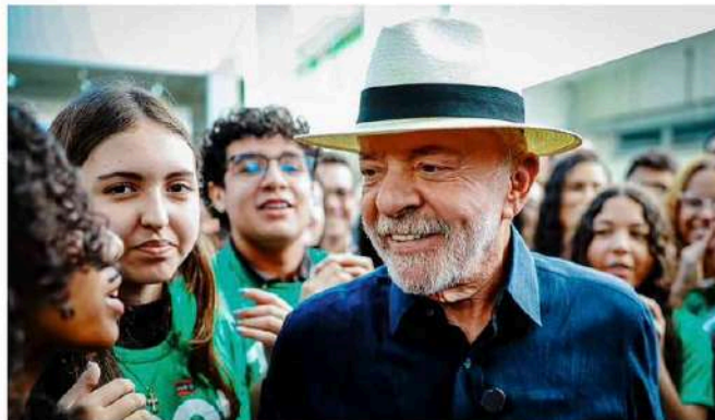
Lula inaugura nova sede do Instituto Federal Goiano em Catalão (GO)