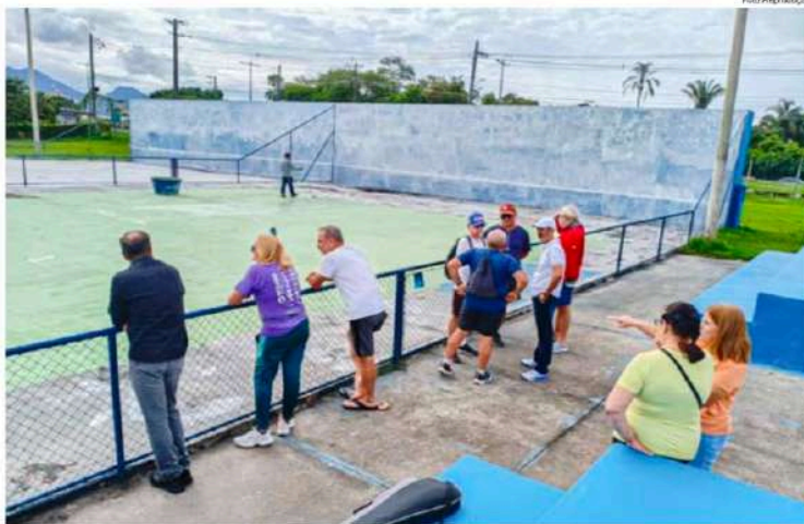
Usuários aguardam final de reforma para retomar atividades no Cemug; trabalho de recuperação é alvo de reclamações em Caraguatatuba