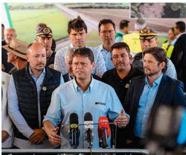
O governador Tarcísio de Freitas (Republicanos) em evento no interior de SP.

de Tarcísio se queixaram do que avaliaram ser uma falta de controle sobre a Polícia Civil e, segundo a Folha apurou, bolsonaristas telefonaram ao governador para reclamar da operação.