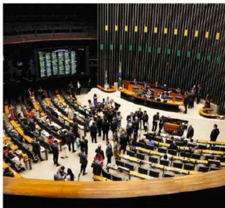
Vista do plenário da Câmara dos Deputados. Pedro Ladeira - 4.mai.26/Folhapress

Segundo a advogada Carla Nicolini, membro da comissão da OAB-SP, as mudanças ajudam a