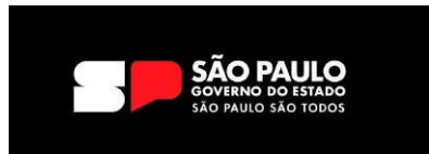
Programas de Governo Estadual