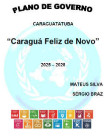
Plano de Governo