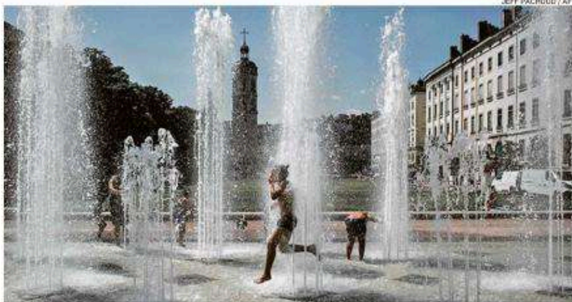
Crianças brincam em fonte em Lyon; a França vem registrando temperaturas bem acima da média

Há, segundo a ONU, 75% de chance de que a média dos próximos cinco anos exceda os níveis pré-industriais em mais de 1,5°C