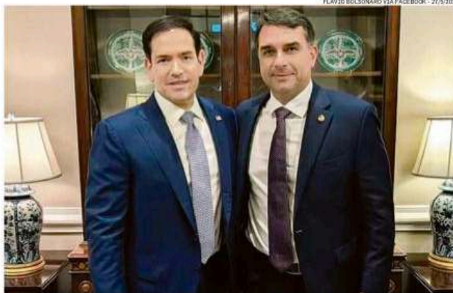
Marco Rubio (à esq.) e Flávio Bolsonaro, em reunião anteontem que discutiu medidas contra facções

Especialistas em facções criminosas apontam, porém, riscos à soberania nacional e a investigações. Dizem, ainda, que o sistema financeiro brasileiro pode ser alvo de sanções americanas, por causa do fluxo de dinheiro do crime organizado, mesmo que os bancos não tenham conhecimento da