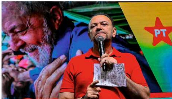
O presidente do PT, Edinho Silva, discursando durante encerramento do congresso do partido 26.abr.26