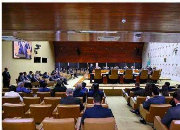
Sessão com ministros do Supremo Tribunal Federal, no plenário da corte constitucional, em Brasília. Antonio Augusto - 20.mai.26/Divulgação STF

As entidades pedem que esse exame “abra espaço para o devido aprimoramento da decisão, conferindo maior clareza a seus fundamentos, à sua extensão e aos seus