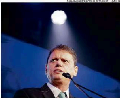
Receio é de que crise atinja o projeto de reeleição de Tarcísio

ESPERA. Agora, segundo aliados de Tarcísio, a ordem é reduzir as aparições ao lado de Flávio até ficar claro o tamanho do envolvimento dele com o caso Master. O filho de Bolsonaro se encontrou reservadamente com integrantes da Faria Lima na quarta-feira passada, sem Tarcísio, que cumpria agendas no interior.