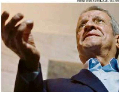
Valdemar: partido não cogita retirar Flávio da disputa presidencial

Quando provocado a confirmar se Flávio foi pedir o restante dos pagamentos, Valdemar disse não ter tratado do tema com o pré-candidato. "Eu pen-