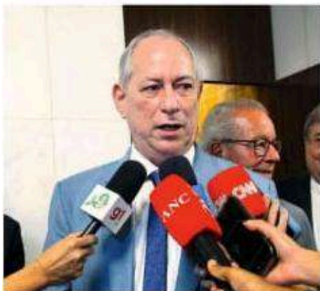
O pré-candidato ao Governo do Ceará, Ciro Gomes (PSDB) , em reunião na Câmara, em Brasília.