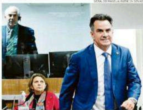
Ciro Nogueira afirmou que negócio foi regular e está declarado

Procurado, Ciro Nogueira, que é presidente do PP e líder do Centrão e foi ministro da Casa Civil do governo de Jair Bolsonaro (PL), confirmou o pagamento e disse, em nota, que a transação é referente à venda de um terreno para construção de uma distribuidora de combustíveis, de forma regu-