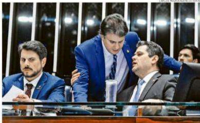
Davi Alcolumbre (à dir.), presidente do Congresso, que deve liberar doações do Executivo no período eleitoral

O governo Lula apoiou a aprovação da proposta na LDO. Depois, o presidente vetou a medida, mas liberou a base governista