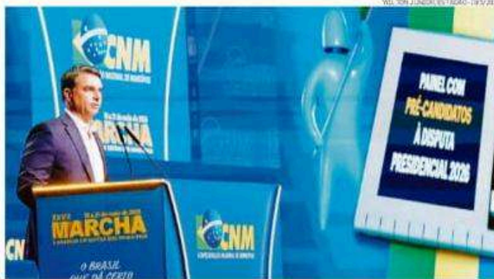
Flávio Bolsonaro (PL) ao participar antontem de painel dos presidenciáveis na Marcha dos Prefeitos

A divulgação de um contrato vinculado ao ex-deputado federal Eduardo Bolsonaro (PL-SP) e de que o fundo que recebeu os recursos é controlado por aliados dele foi usada por governistas para levantar a suspeita de que pelo menos parte do dinheiro envolva re-