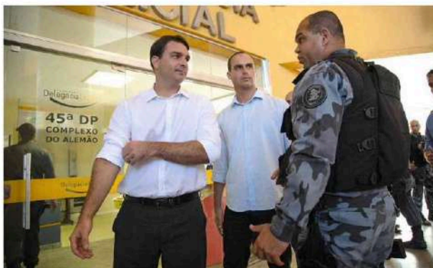
Flávio e Eduardo Bolsonaro durante visita ao Complexo do Alemão, no Rio de Janeiro. RAFAEL PIMENTEL - 10.08.05/Folhapress

Filho de Bolsonaro afirma que foco no combate ao crime organizado em discursos na Alerj nunca impediu sua atuação em outras áreas