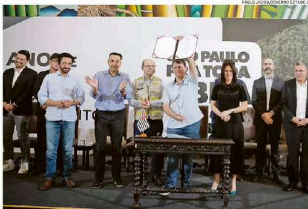
Na semana passada, governo Tarcísio anunciou um pacote de R$ 2 bilhões para mobilidade regional

INFLEXÃO. O movimento marca uma inflexão no estilo adotado por Tarcísio até então. Em outros momentos, o governador chegou a dizer que não fazia “política paróquial” e que sua prioridade era investir em obras estruturantes que deixassem um legado à população paulista. Há uma semana, prefeitos