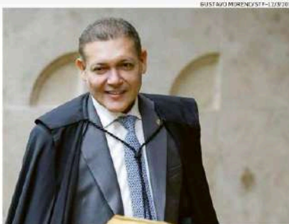
Indicado por Bolsonaro, Nunes Marques é próximo de líderes do Centrão

No documento em que pedem a revisão criminal da condenação, os advogados também solicitam que um novo relator seja sorteado na Segunda Turma para garantir a imparcialidade, com a decisão final submetida ao plenário da Corte. O processo que levou à condenação de Bolsonaro foi relatado por Moraes. Os advoga-