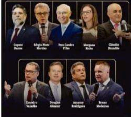
Propaganda de curso do Instituto de Estudos Jurídicos Aplicados

Muito além da teoria: aprende com os maiores nomes da área. Nosso corpo docente foi selecionado para oferecer conhecimento de quem vive a rotina das cortes superiores e domina a construção de teses vencedoras.