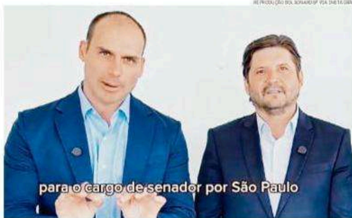
Eduardo Bolsonaro (à esq.) gravou vídeo ao lado do deputado André do Prado, pré-candidato ao Senado

André do Prado já havia confirmado a possibilidade de ter Eduardo de suplente, em entrevista ao Estado publicada no fim de abril. No vídeo anunciando sua pré-candidatura, o presidente da Alesp se colocou como "substituto" de Eduardo e fez acenos ao bolsonarismo, chamando a prisão do ex-presidente de injusta e dizendo que assumiu um compromisso com seu primeiro su-