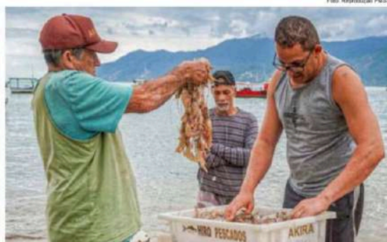
Atividade pesqueira do camarão foi retomada após fim do período de proibição no Litoral Norte

Conhecido como defeso, a medida foca a conservação ambiental. Em todo o litoral paulista o período do defeso tem o objetivo de proteger a reprodução das espécies e assegurar a sustentabilidade