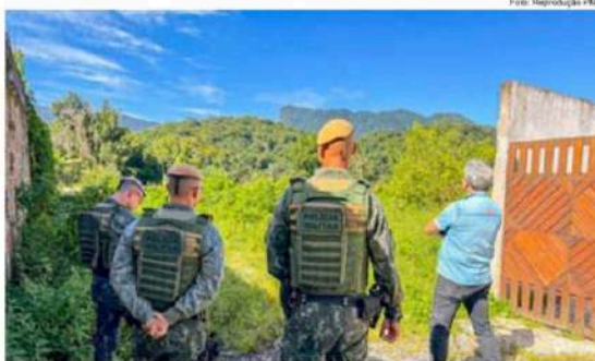
O trabalho de fiscalização ambiental que continua em Caraguatubá com o foco em coibir irregularidades

As autuações e fiscalização ocorreram em diferentes regiões de Caraguatubá, com destaque para os bairros Centro, Porto Novo, Benfica, Jardim Britânia e Poiares. Em uma das ocorrências registradas na região central, a fiscalização identificou um morador envenenando árvores com o objetivo de facilitar a remoção irregular em área particular e também em via pública. O responsável foi autuado pela secretária e pela Polícia Militar Ambiental, respondendo administrativa e criminalmente.