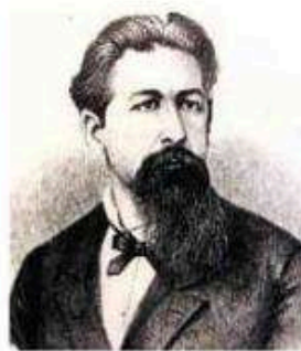
Sêve Navarro, que foi subprocurador da República.