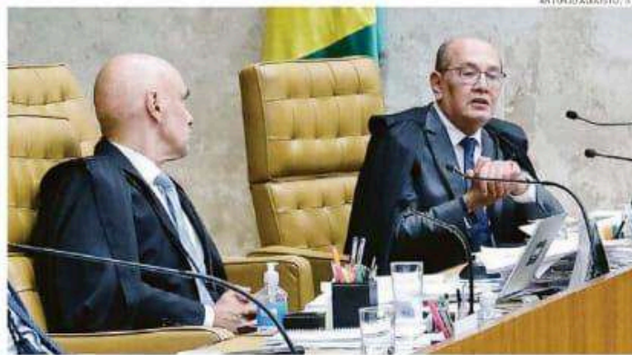
Alexandre de Moraes e Gilmar Mendes; iniciativas dos ministros do STF atingiram pré-candidatos

FORO. Na avaliação dos especialistas, os casos de Zema e Vieira são juridicamente inadequados. O ex-governador de Minas