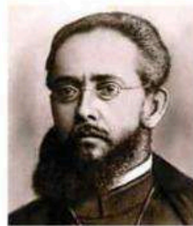
O médico e político Cândido Barata Ribeiro.