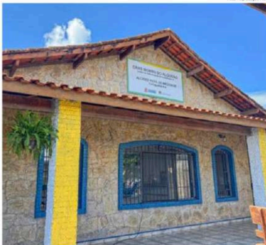
A nova unidade do Cras, que passa a ampliar acesso a serviços sociais na região do Morro do Algodão

Segundo a secretária de Assistência Social, a nova sede, que fica à rua José Lopes de Andrade, 58, deve ampliar o acesso a direitos e o fortalecimento da rede de proteção social, especialmente para famílias em situação de vulnerabilidade social da região sul. Hoje, Caraguatatuba possui cerca de 15,6 mil famílias em situação de vulnerabilidade social, de acordo com os dados do CadÚnico (Cadastro Único). Desse total, mais de 6,5 mil famílias estão em situação de pobreza com renda familiar de até R$109 por capita.