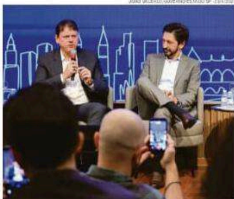
Tarcísio de Freitas (à dir.) quer reeditar parceria com Ricardo Nunes

Tarcísio participou ativamente da campanha de Nunes em 2024. Foi conselheiro do prefeito, apareceu como protagonista em programas do hori-