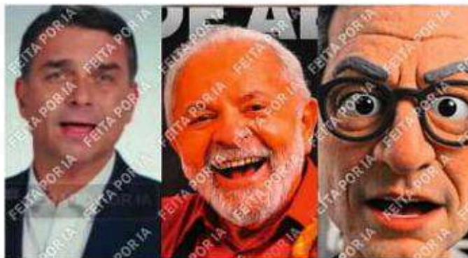
Imagens feitas com uso de IA de Flávio, Lula e Zema. Observatório IA nas Eleições. Folha Zema no Instagram

Nos primeiros meses de 2026, publicações desencadearam disputas judiciais, com denúncias de