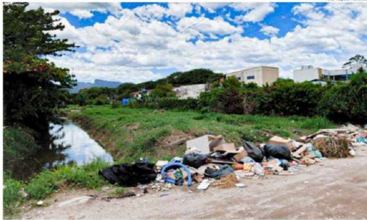
Acúmulo de lixo em trecho de Caraguatatuba, cidade anuncia que prazo para contribuinte fazer o pagamento é fixado no mesmo dia que o IPTU

De acordo com a Prefeitura, a criação da taxa é uma obrigatoriedade legal, com base no Novo Marco Legal de Saneamento Básico, instituído pela lei federal nº 14.026/2020, apontando que, caso a cobrança não seja realizada, configure renúncia de receita pela administração pública, o que pode acarretar penalidade para o Município.