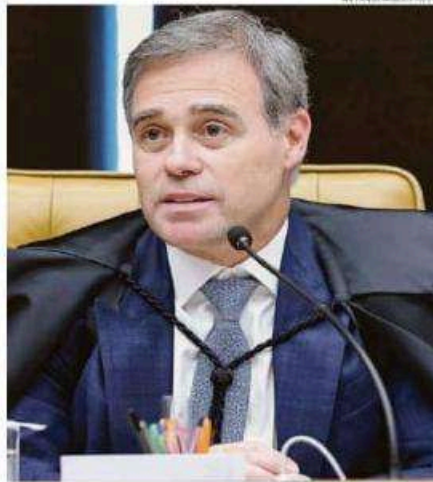
Mendonça é relator no STF da investigação sobre fraudes no INSS

"O gabinete do ministro André Mendonça esclarece que as prisões preventivas decretadas no âmbito da Operação