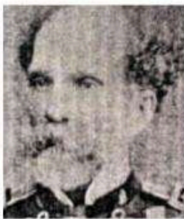
O general Inocêncio Galvão de Queiroz.