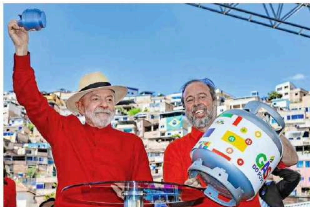
Lula e Alexandre Silveira (Minas e Energia) em evento sobre o Gás do Povo em BH.