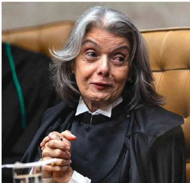
Ministra Cármen Lúcia na abertura do Ano Judiciário 2026 no STF.