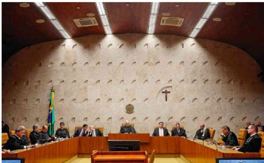
Ministros do Supremo Tribunal Federal no plenário durante sessão de abertura do ano judiciário