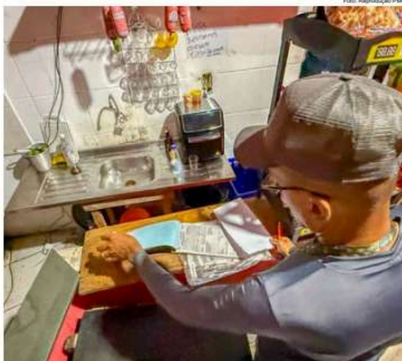
Fiscalização sobre adegas nas ruas de Caraguatatuba; ação conjunta faz varredura em estabelecimentos

Durante a operação, nove adegas foram fiscalizadas em diferentes regiões da cidade. Segundo o Município, as equipes de Urbanismo verificaram documentação, alvarás de funcionamento, AVCB (Auto de Vistoria do Corpo de Bombeiros) e o cumprimento do horário permitido para funcionamento dos estabelecimentos. Em uma das vistorias, foi constatado