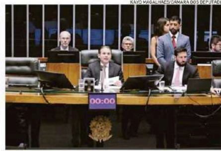
Presidente da Câmara, deputado Hugo Motta, durante votação

Em vídeo na sua rede social, ontem, o presidente da Câmara fez um agradecimento a Lula. "É a interiorização da educação superior e técnica, capacitando os nossos jovens para o futuro. Quero agradecer ao