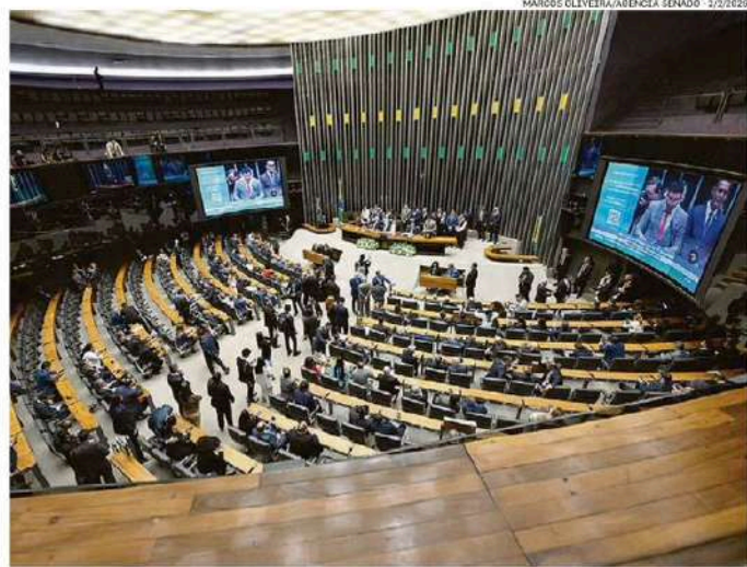
Plenário da Câmara dos Deputados; servidores podem ter ganhos acima do teto constitucional

Apenas o Novo e o PSOL foram contra os reajustes de salários. A votação simbólica impede saber como cada deputado se posicionou sobre o tema. "A covardia com a população brasileira é tremenda e vão fazer votação simbólica. Faço questão de marcar meu posicionamento contrário", disse o deputado Kim Kataguiri (União Brasil-SP). "O que estamos votando contra aqui é que tem uma casta aqui na Câmara. É uma casta que está estabelecendo aqui o fura-teto, sim", afirmou a deputada Heloisa Helena (Rede-RJ).