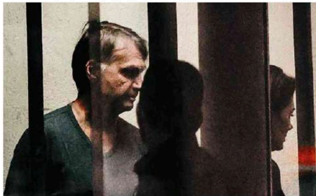
O ex-presidente Jair Bolsonaro (PL) na superintendência da PF em Brasília.

Segundo eles, o ministro tem que seguir a jurisprudência e garantir o direito à prisão domiciliar nesses casos. Isso ainda não aconteceu, segundo interlocutores do ex-presidente, por causa da tensão entre o bolsonarismo e o Supremo, que acaba gerando retaliação contra o político detido. Deputados da direita falam em injustiça, perseguição e cerceamento de defesa no processo. Como mostrou a Folha, a prin-