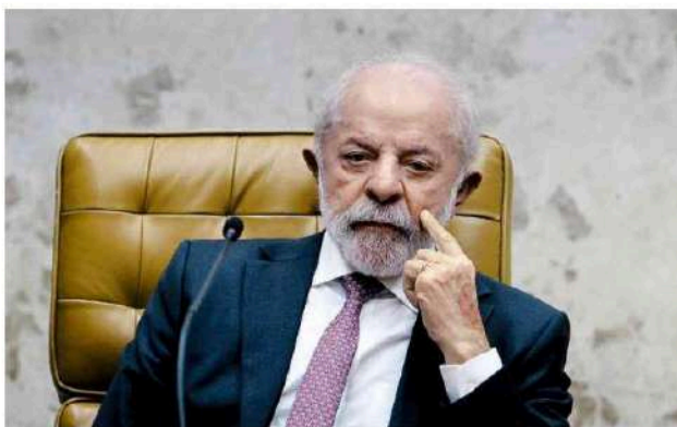
O presidente Lula (PT) em sessão do Supremo Tribunal Federal, em Brasília. Sérgio Lima - 2 fev. 26 / AFP

A sugestão foi enviada ao TSE na consulta pública aberta sobre a atualização das resoluções