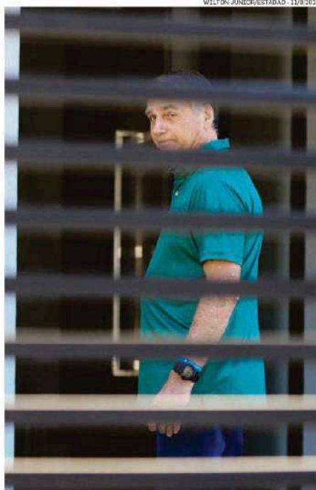
Jair Bolsonaro em sua casa, no dia em que foi condenado pelo STF

O Estadão apurou que diversos membros do STM devem levar em consideração "a vida progressa" dos militares con-