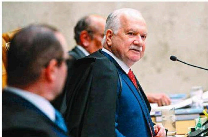
O presidente do Supremo, ministro Edson Fachin, em sessão da corte, em Brasília.