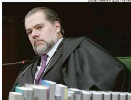
Decisão de Dias Toffoli autorizou a Nupec a receber R$ 200 milhões

Dias antes da decisão que bloqueou os R$ 56 milhões da Nupec, o Ministério Público solicitou que "o município de São Sebastião se abstenha de efetuar qualquer pagamento