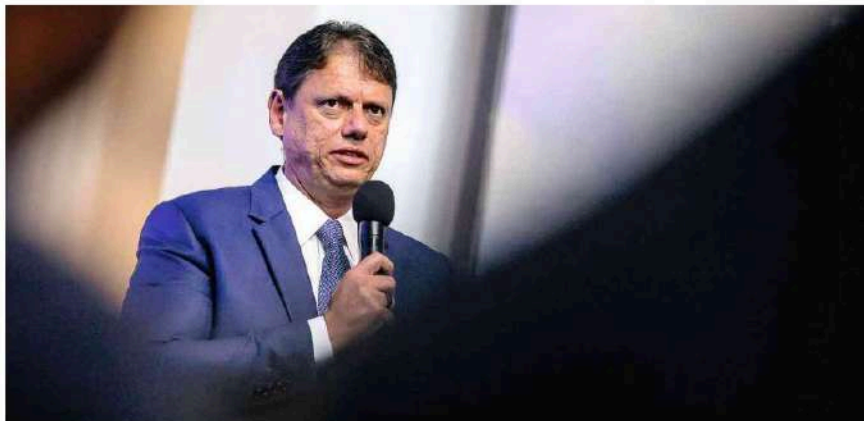
O governador de São Paulo, Tarcísio de Freitas, participa de solenidade na Universidade de São Paulo.