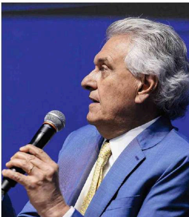
O governador Ronaldo Caiado participa de seminário do grupo Esfera.

O presidente do PSD chegou a declarar que apoiaria uma can-