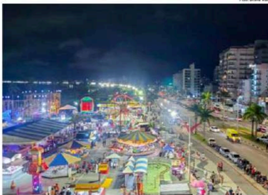
Evento e movimentação na orla de Caraguá; cidades do Litoral mantêm ações por movimento turístico.

Em Ubatuba, a Prefeitura informou apenas que "a fiscalização nas praias ocorre regularmente, com foco principalmente nas atividades de comércio ambulante e instalação de tendas".