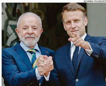
Lula durante visita a Macron, em 2025; conversa em defesa da ONU

Embora não tenha decidido como responder à proposta, Lula conversou com Trump, na segunda-feira, a quem pediu que a iniciativa incluía a Palestina e se concentre exclusivamente na guerra em Gaza. Na sexta-feira, o brasileiro acusou Trump de querer “ser dono” de uma nova ONU. Lula já havia conversado com o presidente chinês, Xi Jinping, sobre o tema, na