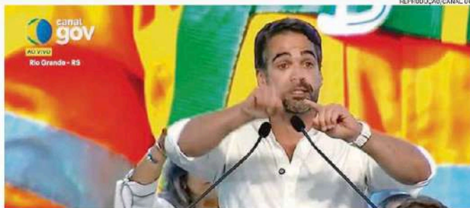
Em evento com Lula, Eduardo Leite, governador do RS, é hostilizado, pede respeito e crítica polarização

da militância petista contra ele é um sinal de acirramento da polarização e lembrou o resultado dividido da última eleição presidencial. Ainda citando um mote governista, ele disse que não se pode "hostilizar quem pensa diferente" para conseguir a "união e reconstrução". Além disso, ele disse que a postura dos presentes "incendia ódio, rancor e mágoa" em uma parte da população.