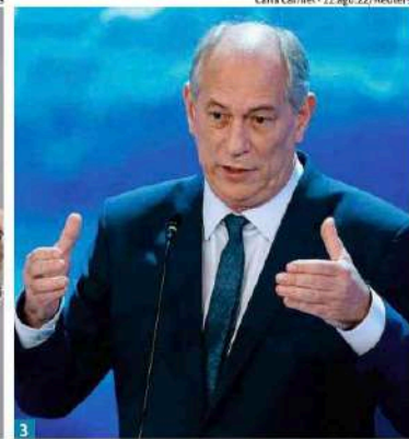
1 O ministro da Educação, Camilo Santana (PT); 2 o governador do Ceará, Elmano de Freitas (PT); 3 e Ciro Gomes (PSDB), pré-candidato a governador do Ceará neste ano