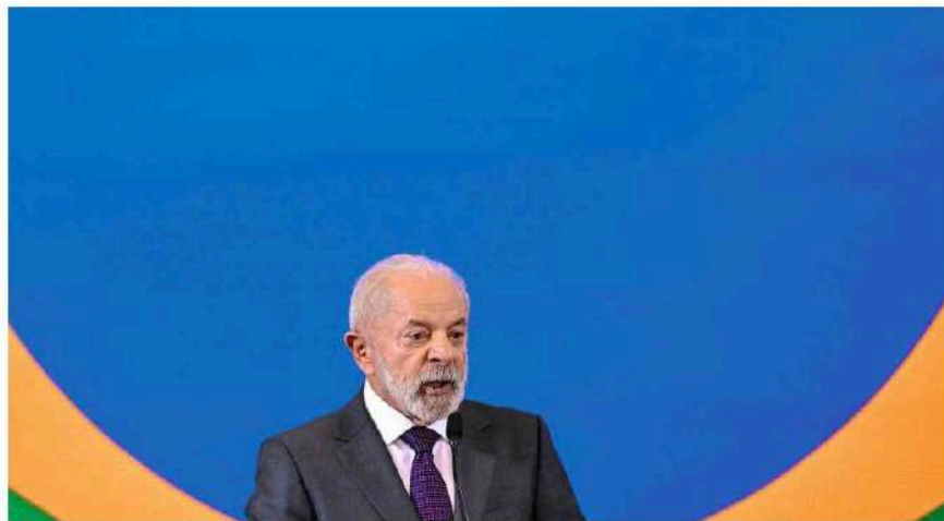
O presidente Lula (PT) em discurso em reunião do chamado Conselho, no Palácio do Planalto, em Brasília.