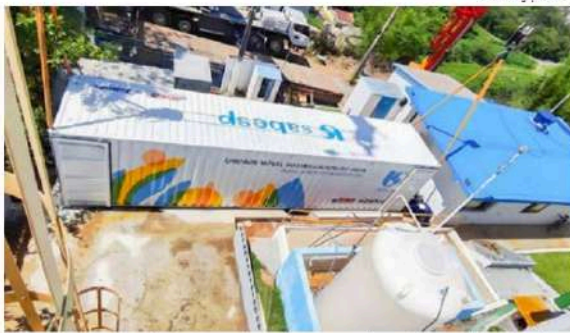
Estrutura da Sabesp, parte de planejamento de ampliação no atendimento da companhia no Litoral Norte

A operação inclui a implantação de unidades móveis de tratamento de água e a instalação de novos reservatórios em contêineres concentrados em áreas que apresentaram maior demanda no início deste ano. Segundo a companhia, três unidades móveis de tratamento de alta tecnologia foram distribuídas pelo Litoral