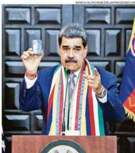
Maduro em evento em Caracas; regime sob pressão dos EUA

"Podemos sempre ser um ponto de negociação e de encontro. Se as partes assim o considerarem, terão de nos propor isso. Caso contrário, deverão procurar outros mediadores para evitar qualquer conflito na região", disse a mexicana.