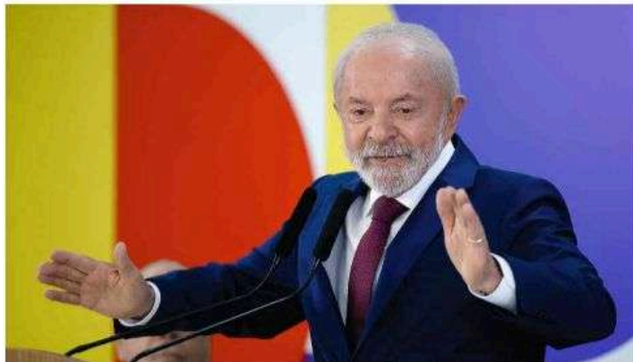
O presidente Lula (PT) em café da manhã com jornalistas no Palácio do Planalto, em Brasília.