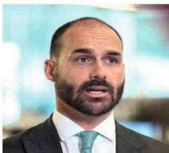
O deputado federal cassado Eduardo Bolsonaro (PL-SP) em entrevista.

Motta e maioria dos membros da Mesa Diretora votam pela perda de cargos; líder do PL na Casa critica deliberação e afirma que recorrerá