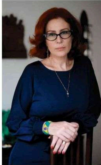
A ex-deputada Carla Zambelli (PL-SP) em entrevista à Folha em apartamento em Brasília. Pedro Ladeira - 26.mar.25/Folhapress

Esta é a terceira vez que o julgamento, inicialmente marcado para o fim de novembro, foi adiado. Primeiro, devido à adesão da defesa da ex-congressista a uma greve de advogados e, depois, porque o tribunal pediu tempo para decidir se novos documentos apresentados pelos advogados