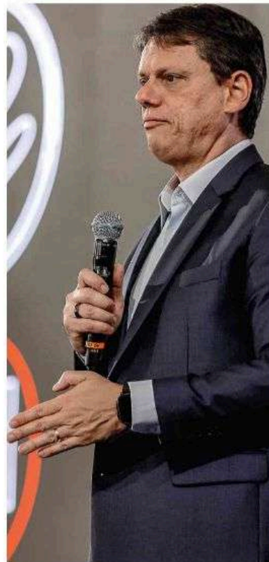
O governador de São Paulo, Tarcísio de Freitas (Republicanos), em balanço da gestão estadual.

Neste último ponto, Tarcísio enalteceu a privatização da Sabesp (Companhia de Saneamento Básico do Estado de São Paulo), citando premiação internacional concedida ao governo em Nova York, sem especificar qual.