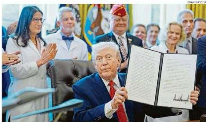
Trump com o decreto da maconha na mão: rara convergência entre republicanos e democratas

No entanto, a mudança não ocorre sem resistência. Congressistas republicanos – 18 senadores e 26 deputados – enviaram cartas ao presidente opondo-se à reclassificação. O CatholicVote, grupo conservador, também pressionou Trump.