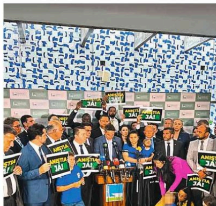
Bancada do PL faz ato na Câmara por anistia Reprodução Daniela Reinher no Instagram

A estratégia da oposição, que diz ter como prioridade número um o PL da Anistia, é juntar os votos, pedir para Motta desis-