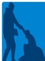
1º Fórum Municipal da Pessoa em Situação de Rua

A Prefeitura de Caraguatatuba, por meio da Secretaria de Desenvolvimento Social e Cidadania e em parceria com a Organização Social Restitui , realiza no dia 17 de agosto, a partir das 8h, o 1º Fórum Municipal da Pessoa em Situação de Rua.