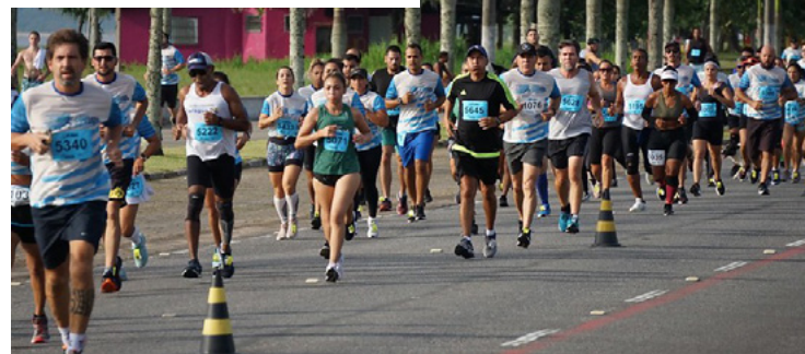
corrida – sábado (29/07).

O local para a retirada do kit será o Caraguá Praia Shopping, localizado na Avenida Dr. Arthur da Costa Filho, nº 937, no Centro, no horário das 10h às 15h, no mesmo dia da