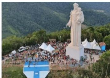
Imagem de Santo Antônio e iluminação do morro são entregues em Caraguatatuba