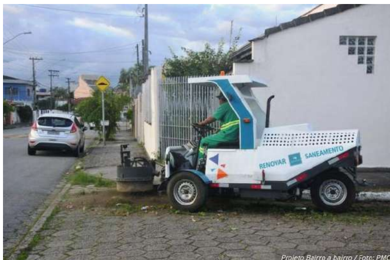
Projeto Bairro a bairro

Nesta semana, de 16 a 20 de maio, a Prefeitura de Caraguatatuba, por meio da Secretaria de Serviços Públicos, estará com o programa 'Bairro a Bairro' nas regiões da Martim de Sá, Prainha, Jardim Forest, Ipiranga, Ponte Seca, Jardim Samambaia, Jardim Aruan, Jardim Jaqueira e Sumaré.