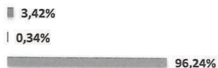
Quadro n.º 54 - Demonstrativo dos saldos por fonte de recurso