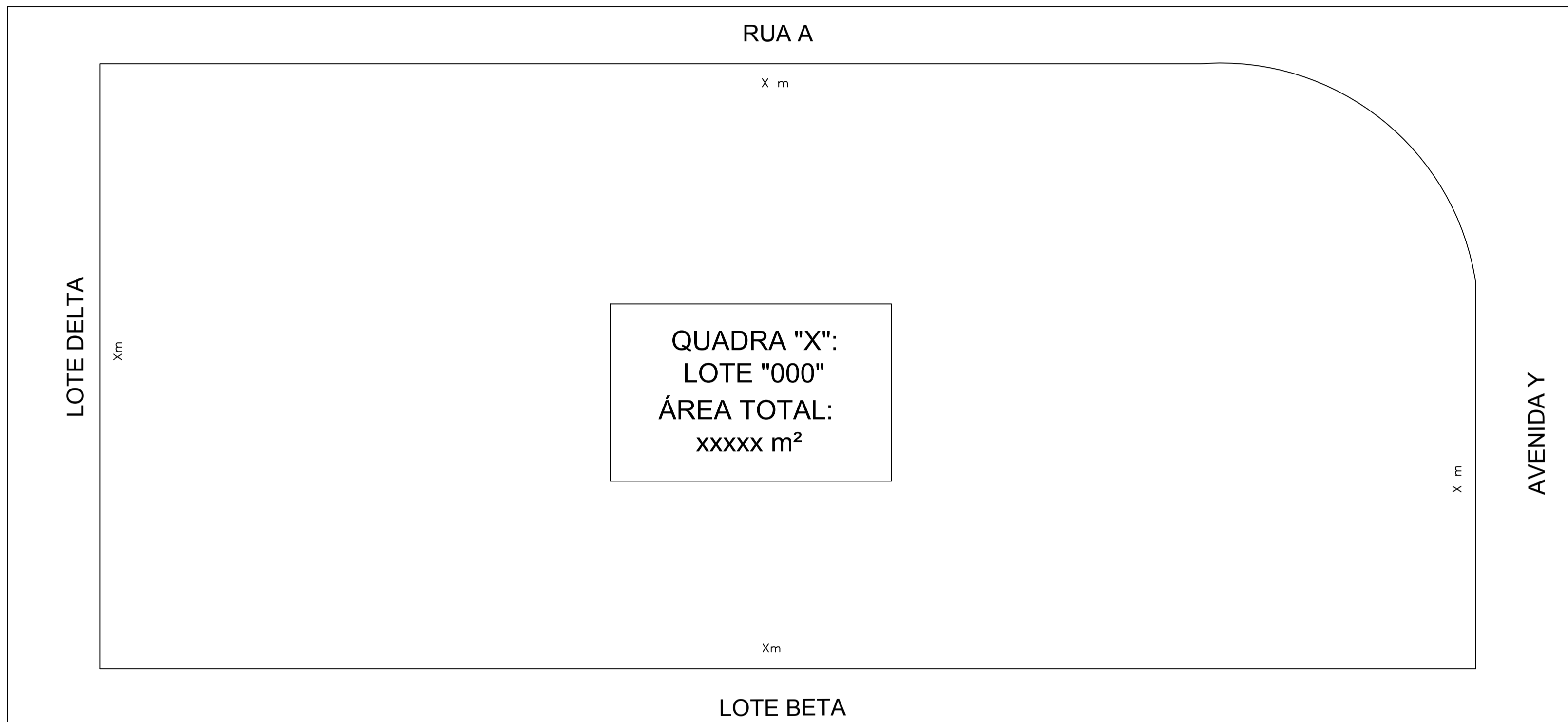
01 - SITUAÇÃO ATUAL