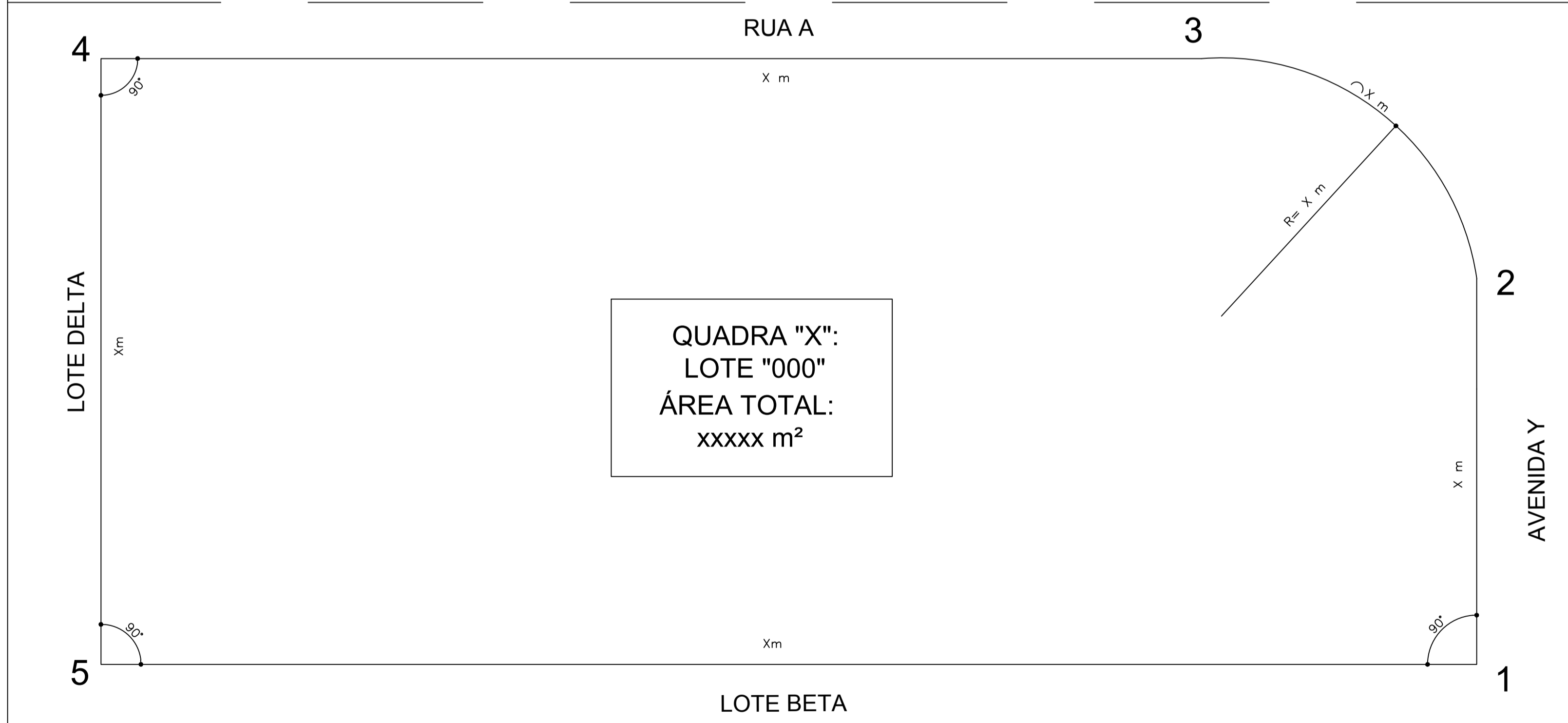
02 - SITUAÇÃO RETIFICADA