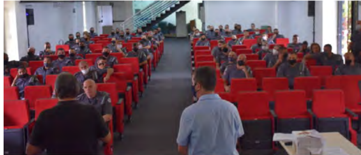
Policiais militares que devem reforçar a segurança e a fiscalização de Ilhabela; cidades do Litoral temem por chegada de turistas neste verão

Cidades recebem mais de seiscentos policiais, que planejam fiscalizações contra avanço da Covid-19