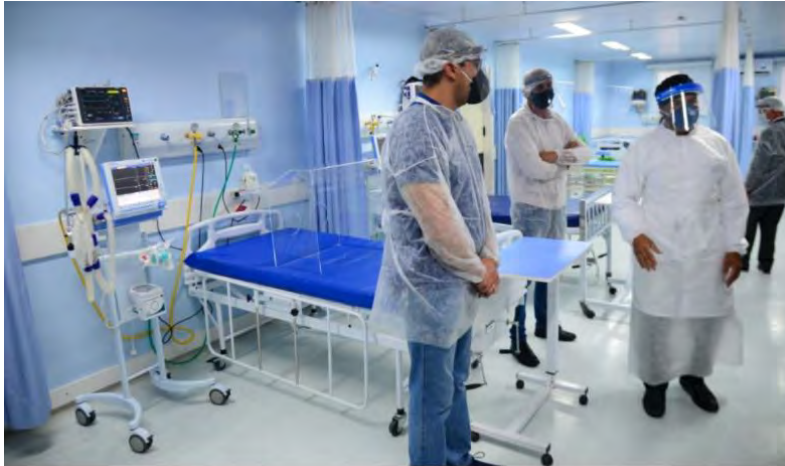
Leitos e equipe médica do Hospital Regional de Caraguá; prefeitos pedem reforço para atender casos de Covid-19

Municípios pedem a Doria mais estrutura diante do possível avanço da Covid-19; grupo pede também maior apoio em fiscalizações