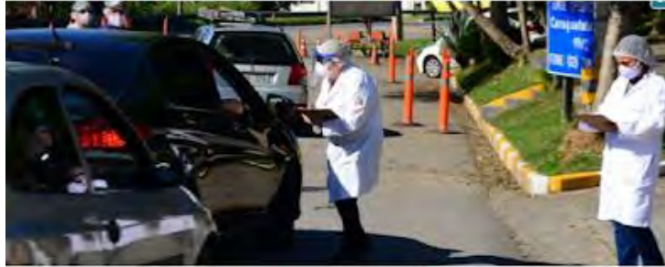
Cidades devem implantar barreiras sanitárias

O COMITÊ DE SAÚDE DO ESTADO DETERMINOU QUE APENAS SERVIÇOS ESSENCIAIS PODERÃO FUNCIONAR NO LITORAL NORTE NOS DIAS 25, 26 E 27 E, DEPOIS, NOS 1, 2 E 3 DE JANEIRO. POSTOS DE COMBUSTÍVEIS, SUPERMERCADOS, FARMÁCIAS E PADARIAS ABRIRÃO NORMALMENTE.