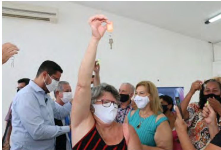
#PraCegoVer: Artesã levanta chave do quiosque durante a cerimônia de entrega da revitalização da Praça Diógenes Ribeiro de Lima

A Prefeitura de Caraguatatuba, por meio da Secretaria de Obras, entregou na manhã desta terça-feira (22) as obras de revitalização da Praça Diógenes Ribeiro de Lima, no Centro.