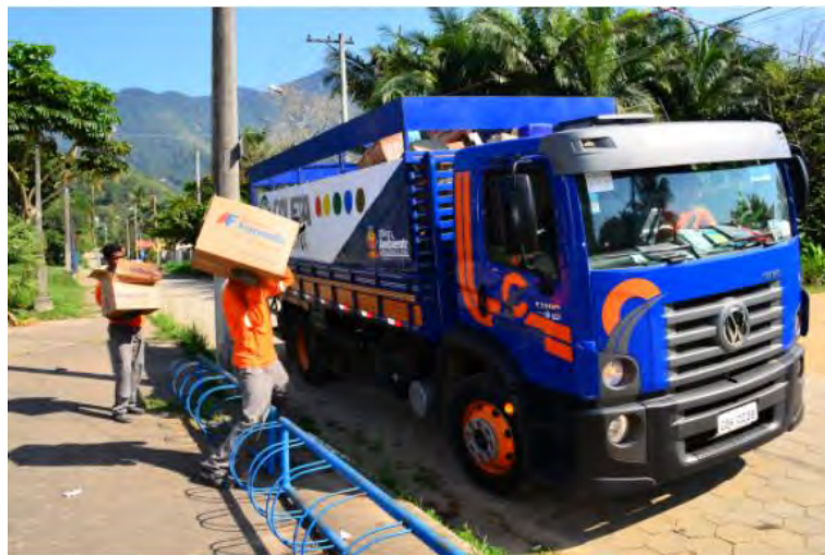
#PraCegoVer: Caminhão da coleta seletiva com vários materiais dentro e dois homens carregam caixas de papelão para dentro

A Prefeitura de Caraguatatuba, através da Secretaria de Meio Ambiente, Agricultura e Pesca (SMAAP) informa que o serviço de coleta seletiva e os ecopontos estarão com as atividades suspensas devido ao feriado de Natal.