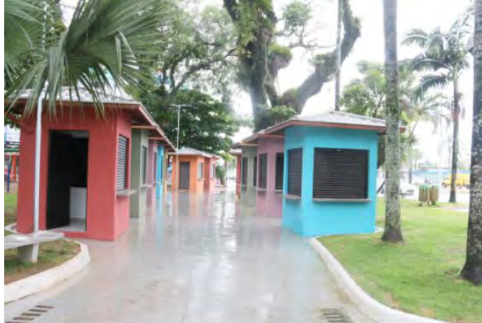
#PraCegoVer: Quiosques da Praça Diógenes Ribeiro de Lima que receberam suas respectivas pinturas

Eles nos orientaram, e mostrou como o projeto iria se tornar uma realidade”. “Os artesãos ganharam um espaço mais adequado para trabalhar com qualidade. Agora, nós temos um local mais decente e seguro, principalmente por conta das chuvas, e não vamos precisar mais fazer a montagem e a desmontagem”, disse a artesã da Femaac há mais de onze anos, licenciada em bijuteria.