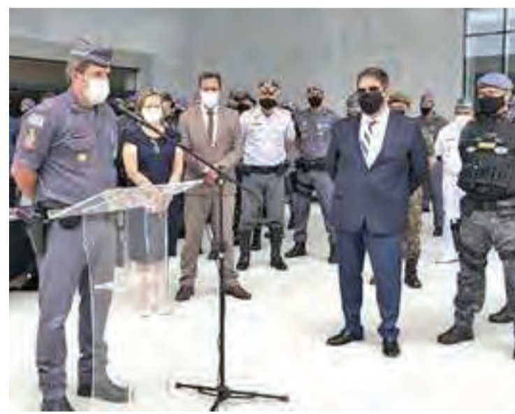
O comandante geral da PM, Fernando Alencar, fala durante o evento

Paralelamente ao aumento no efetivo e nas ações de patrulhamento, a SSP reforça as orientações e recomendações das autoridades de saúde para o combate ao novo coronavírus. “A Polícia Militar, assim como tem feito desde o início da pandemia, continuará apoiando os órgãos municipais e a vigilância sanitária, responsáveis pelas fiscalizações e demais ações para coi-