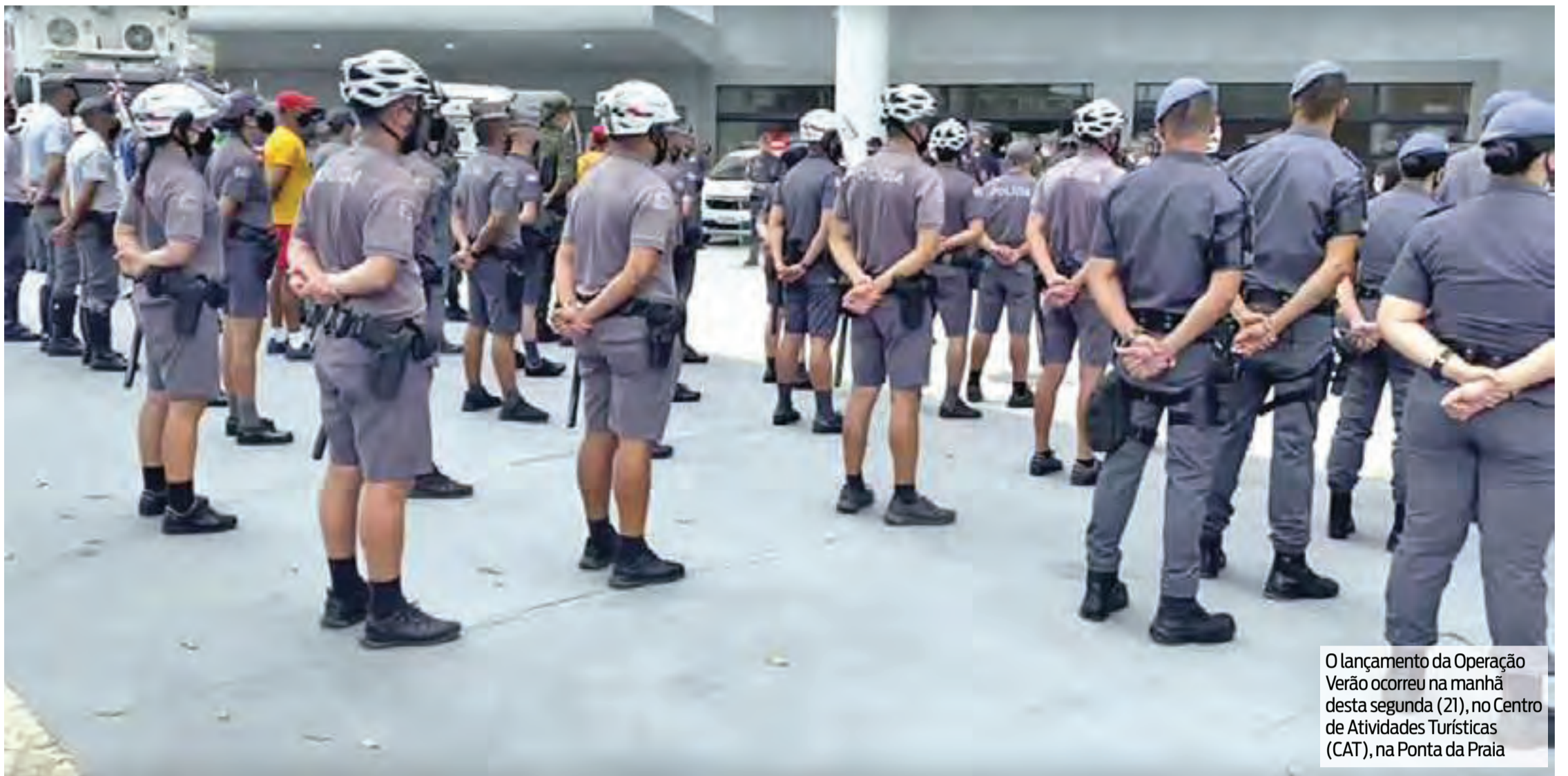
O lançamento da Operação Verão ocorreu na manhã desta segunda (21), no Centro de Atividades Turísticas (CAT), na Ponta da Praia