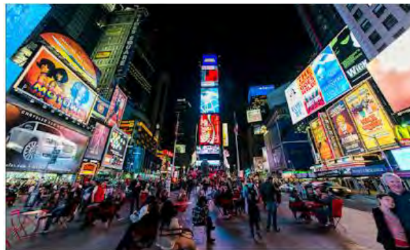
Turistas do mundo inteiro circulam pela Time Square

Segundo a @Stone, a ação faz parte da campanha “Negócios são motores de sonhos” produzida com carinho pelo time em homenagem aos pequenos e médios lojistas do país”, informou a @Stone.