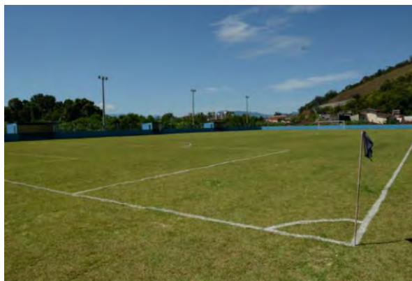
#PraCegoVer: O campo oficial com arquibancada no Casa Branca