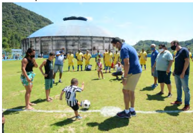
#PraCegoVer: Criança dá o primeiro chute na bola do do campo de futebol com arquibancada no bairro Casa Branca

Desde domingo (20/12) o bairro Casa Branca ganhou oficialmente um campo de futebol oficial com arquibancada.