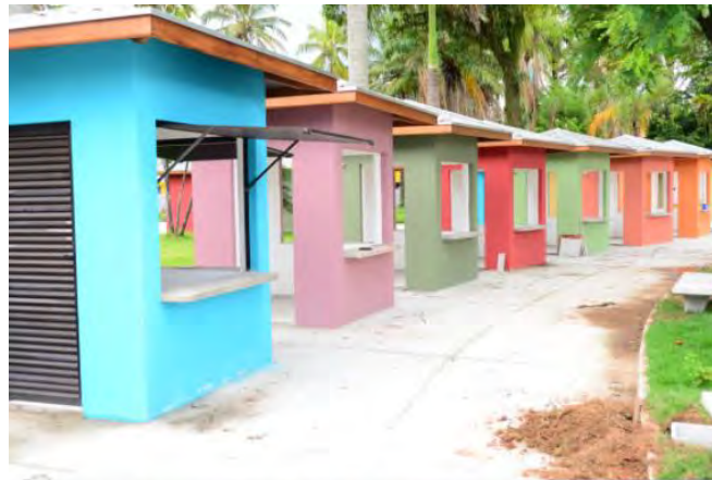
#PraCegoVer: Quiosques da Praça Diógenes Ribeiro que receberam suas respectivas pinturas

As obras de revitalização da Praça Diógenes Ribeiro de Lima (Praça do Artesão), localizada no Centro de Caraguatatuba, serão entregues na próxima terça-feira (22/12).