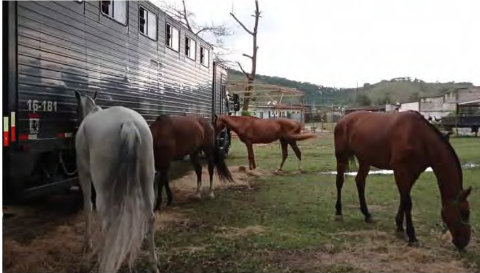
Cavalos da Polícia Militar em Caraguatatuba.

A cavalaria da Polícia Militar está em Caraguatatuba para reforçar Operação Verão 2020/2021. A tropa pertence ao Regimento de Cavalaria 9 de Julho, com sediada na companhia do Baep (Batalhão de Ações Especiais da Polícia), em Taubaté.