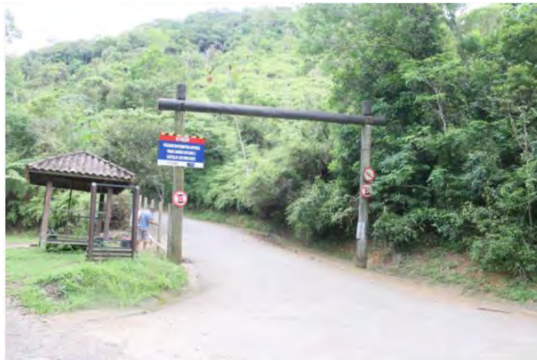
#PraCegoVer: Entrada para o Morro Santo Antonio, onde tem um homem próximo a uma cerca

A partir da próxima semana dois pontos turísticos de Caraguatatuba vão ter controladores de acesso. A Prefeitura de Caraguatatuba vai colocar guaritas e cancelas nas subidas do Morro Santo Antonio e Complexo Turístico do Camaroeiro.