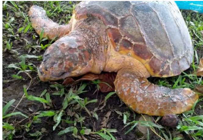
A Tartaruga-cabeçuda foi encontrada morta

O Instituto Argonauta recolheu o animal e fará a autópsia para descobrir a causa da morte