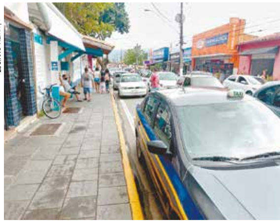
Taxistas deverão ter reivindicações atendidas se PL foi aprovado pela Câmara

O fato – Os taxistas de São Sebastião terão algumas de suas reivindicações atendidas. A promessa é que a prefeitura enviará, em breve, um Projeto de Lei à Câmara com esse objetivo.