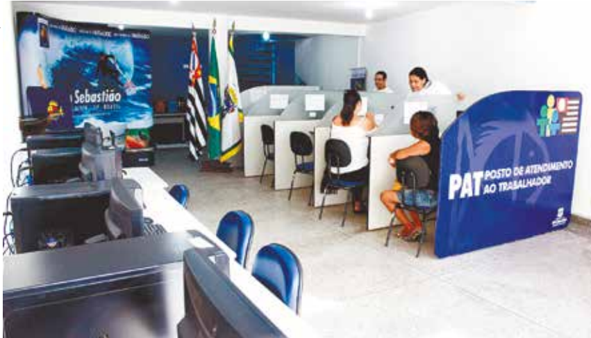
PAT é uma referência de empregabilidade nas cidades de toda a região

O detalhe - Segundo a PMSS, a informação é confirmada pelo índice do Cadastro Geral de Empregados e Desempregados (Caged), que divulgou os dados referentes à empregabilidade do mês de outubro no país. Mesmo com a pandemia, o município teria criado mais de 16 mil vagas de emprego, sendo no mês de outubro mais de 900 novas oportunidades de