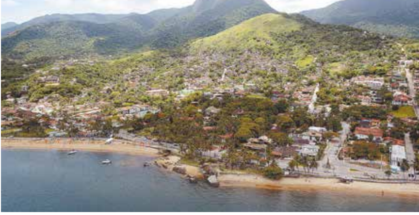
Cidade manteve o mesmo valor do IPTU de 2020 para 2021