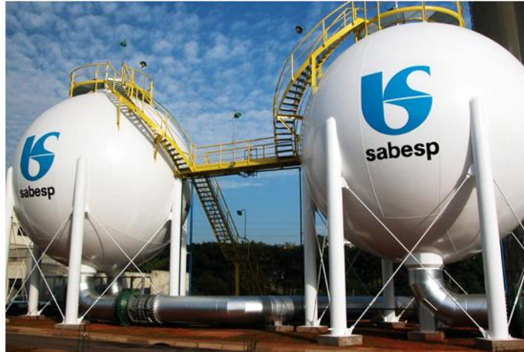
Sabesp investe para a temporada de verão

Empresa teria se preparado ao longo de 2020 com melhorias dos sistemas para atender população