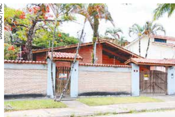
Imóvel à venda em Caraguatuba

O detalhe – A liderança no mercado imobiliário é a capital São Paulo. Na Região Metropolitana do Vale e Litoral Norte, Caraguatuba lidera entre as cidades com mais de 100 mil habitantes. A outra cidade mais próxima é São José dos Campos, na 38ª posição. O ranking é calculado através da metodologia de análise estatística chamada IQM (Índice de Qualidade