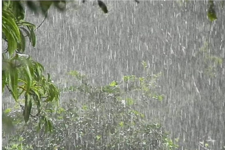
Volume de chuva pode chegar a 100 mm na região, segundo Defesa Civil

O volume pode chegar a 100 mm e a população deve se manter atenta