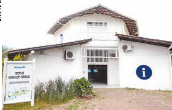
Novo espaço passou por um projeto de restauro e cenografia e está pronto para abrigar o CITI

A opinião - O CITI facilitará a vida dos turistas, que poderão sair do prédio com seus roteiros e passeios comprados. Poderá estimular os turistas de um dia a conhecerem atrações diferentes de Ilhabela e não se concentrarem em uma única praia.