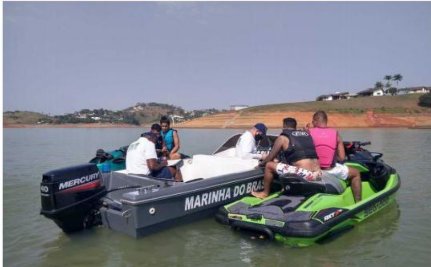
Patrulhamento será feito em toda região durante a Operação Verão

O objetivo é reduzir o número de acidentes de navegação