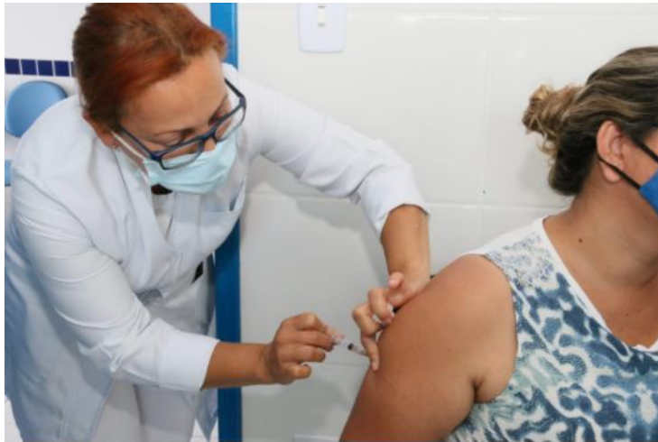
#PraCegoVer: Enfermeira aplica vacina em uma mulher

A Campanha Nacional contra influenza (H1N1), iniciada em março, se encerrou no final de novembro. Ao todo, 52.780 pessoas, entre idosos, crianças (de seis meses a cinco anos), puérperas (com 45 dias pós-parto), grávidas e trabalhadores de saúde, receberam a dose da vacina em uma das salas de vacinação do município.