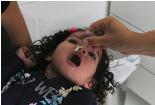
IMG 2 #PraCegoVer: Criança recebe dose da vacina contra a paralisia infantil

A Vigilância Epidemiológica (VE) da Secretaria de Saúde de Caraguatuba divulgou nesta sexta-feira (11) o resultado das Campanhas de Vacinação contra sarampo e poliomielite. As duas foram encerradas no fim do mês passado pela Prefeitura.