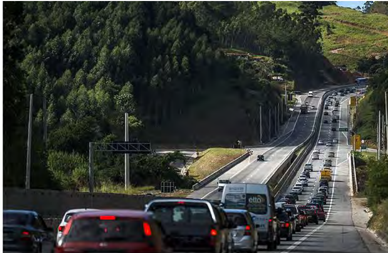
Pedágios aumentam a partir de amanhã no Km 59,3

As tarifas saltaram para R$ 7,80 na praça de Paraibuna, nos dois sentidos da rodovia