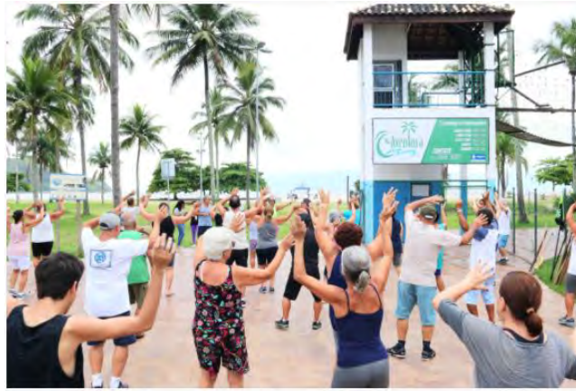
#PraCegoVer: Idosos fazem atividades ao ar livre na praia.

Em essência, essa liderança ocorre em consequência de ser, entre essas cidades, a que evidencia a maior frequência de casamento entre idosos. Além disso, Caraguatatuba foi identificada entre as 10 cidades de melhor desempenho em bem-estar.