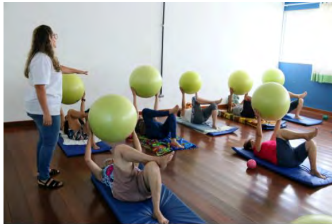
#PraCegoVer: Idosos deitados em colchonetes fazem exercícios com bolas de plástico grandes;

A cidade de Caraguatatuba é destaque no Índice de Desenvolvimento Urbano para a Longevidade (IDL), que tem como objetivo avaliar o preparo de 876 municípios brasileiros para a longevidade da população.