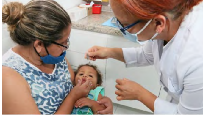
Prefeitura de Caraguatatuba

Ações terminam na próxima segunda-feira 30