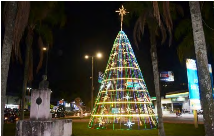
Árvore de Natal instalada em uma das entradas de cidade

Elas estão instaladas nas principais rotatórias da cidade