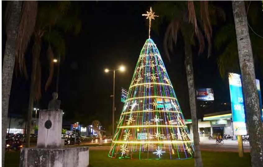
(Árvore de Natal em Caraguatatuba. Foto: JC Curtis/Fundacc)

Caraguatatuba entra em clima natalino com as tão esperadas luzes e árvores de Natal que todos os anos enfeitam as rotatórias do município e encantam munícipes e turistas.