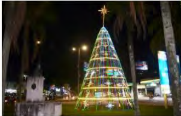
Árvore de Natal instalada em uma das entradas de cidade

Outro local que receberá decoração de Natal é a Praça Dr. Cândido Mota, garantindo, assim, mais um ponto onde as pessoas poderão registrar suas selfies e visitar o Coreto mais famoso de toda Caraguá.