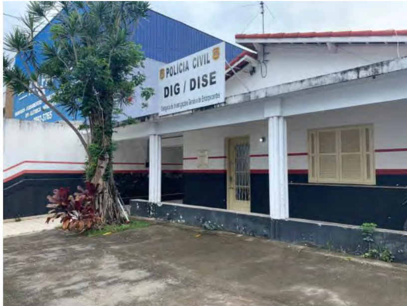
Investigação é conduzida pela Seccional de São Sebastião

Operação foi realizada na manhã desta terça-feira (17) em cidades do litoral norte de São Paulo, Vale do Paraíba e Alto Tietê.