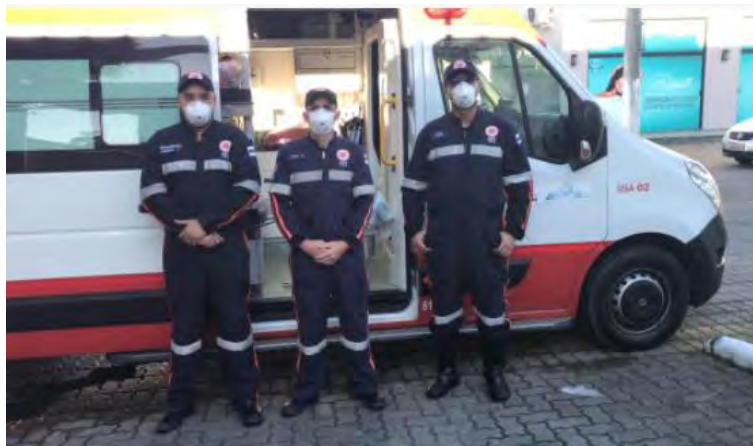
#PraCegoVer: Profissionais do SAMU posam para foto em frente à ambulância

Neste mês, o Serviço de Atendimento Móvel de Urgência (SAMU) está comemorando dez anos de atuação em Caraguatatuba. O serviço foi inaugurado no dia 22 de novembro de 2010. De lá pra cá, já foram realizados 141.562 atendimentos de urgência e emergência, desde acidentes, até em casos onde eles auxiliam ou realizam partos.