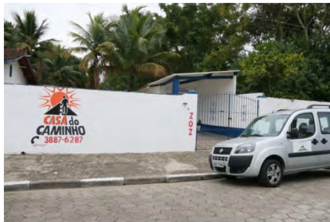
#PraCegoVer: Fachada da Casa do Caminho, com veículo estacionado na frente

Atualmente, permanecem acolhidos 22 homens e duas mulheres na Casa do Caminho, e 11 na Comunidade Terapêutica Restitui, que possui parceria com a Prefeitura.