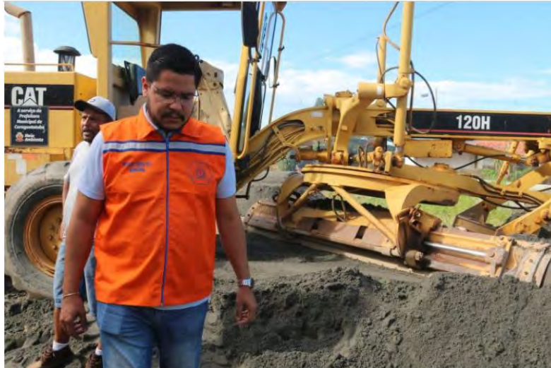
O prefeito Aguilar Júnior, alvo de processo de cassação de mandato; suposto desfalque de R$ 10 milhões

Aguilar Junior é denunciado por infração administrativa e falta de decoro; prefeito classifica ato como “arbitrário e político”