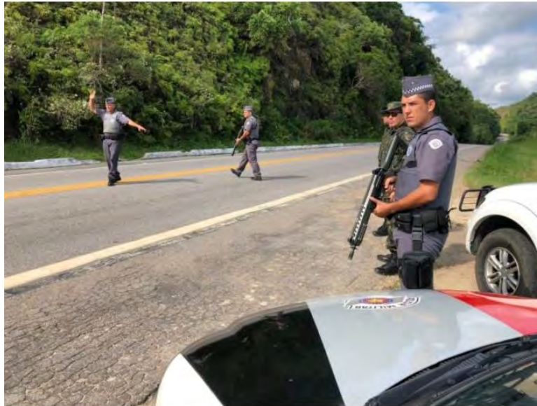
Policiais Militares chegam a região no dia 21 de dezembro

Durante a temporada, a população local salta de 400 mil habitantes para mais 1,5 de milhão de pessoas e o número de ocorrências também aumenta