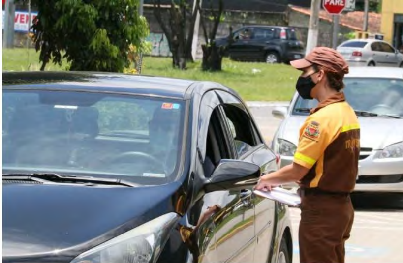
Agente de trânsito em fiscalização a motorista de aplicativo em Caraguatatuba

Ação serve para verificar se o transporte de passageiros é realizado corretamente