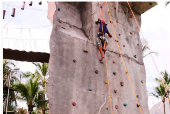
#PraCegoVer: Menino no topo da escalada preso por equipamentos de segurança

A Prefeitura de Caraguatatuba, por meio da Secretaria dos Direitos da Pessoa com Deficiência e do Idoso (Sepedi) retomou o funcionamento do Espaço Aventura, localizado no Centro da cidade. O local oferece práticas de escalada, arvorismo, rapel e tirolesa. Os equipamentos são seguros, sempre acompanhados por monitores.