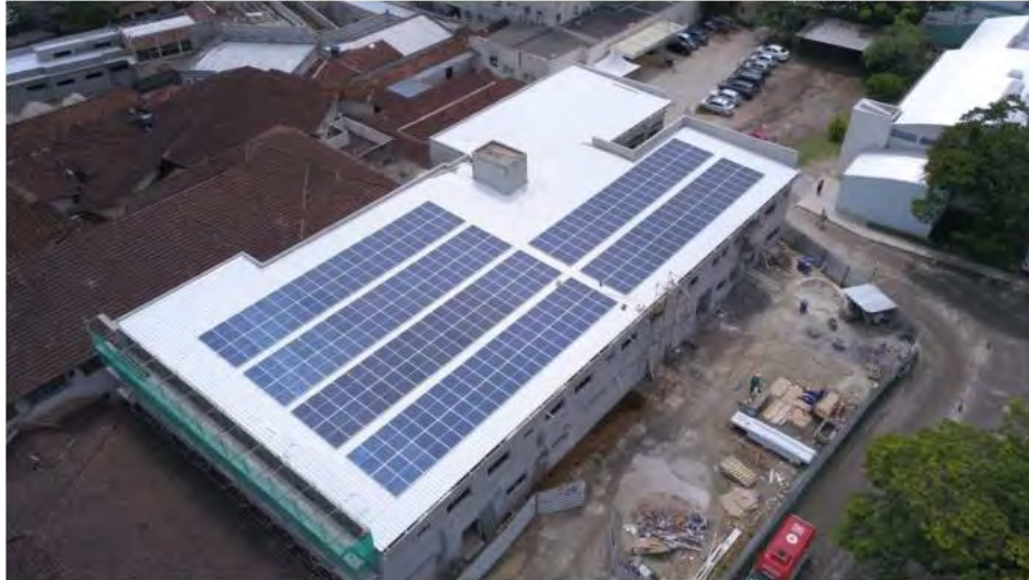
Placas solares instaladas nos novos leitos construídos no hospital

São 240 placas que transformam luz do sol em energia e são ecologicamente corretas