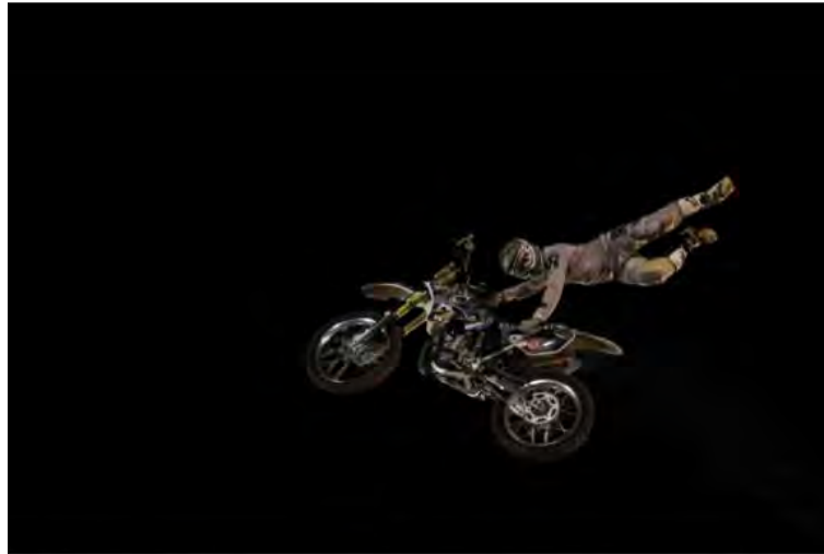
#PraCegoVer: Competidores correm e voam em motos nas edições passadas do Arena Cross em Caraguatatuba

Para os pilotos e colaboradores do evento, será obrigatória a regra do distanciamento social entre os atletas na área de boxes, com o número reduzido de integrantes.