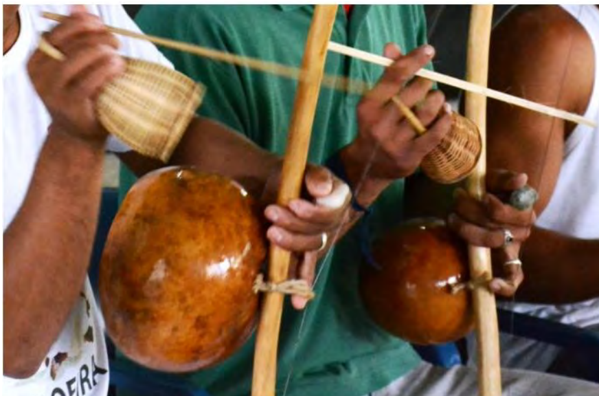
Este ano, a festa Kizomba será online por conta da Pandemia

A transmissão será pelo Facebook da Zambô e da Fundação Educacional e Cultural de Caraguatatuba