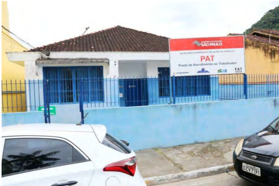
Fachada do PAT de Caraguatatuba que encaminha os currículos

Além destas oportunidades, outras 160 vagas estão abertas para atuar em diferentes funções e regiões da cidade