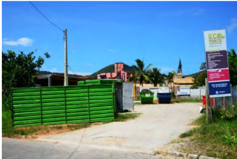
#PraCegoVer: Fachada Ecoponto com portão de ferro na cor verde

Devido ao feriado do Dia da Consciência Negra, celebrado na próxima sexta-feira (20), o Programa da Coleta Seletiva terá o atendimento suspenso, retornando na segunda-feira (23).