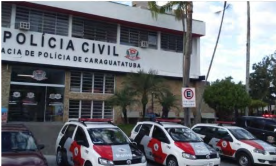
Sede da delegacia de Caraguá, que investiga crimes de assassinato na cidade

Jovem e adolescente são mortos em curto intervalo de tempo; crimes podem ter relação com o tráfico