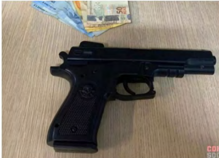
Homem foi preso com simulacro de arma de fogo

Segundo a PM, homem usava simulacro de arma de fogo para render vítimas. Ele foi preso com R$ 180 que tinham sido levados do caixa de comércio no bairro do Tinga.