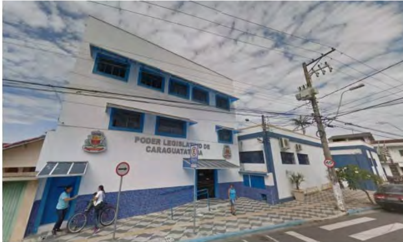
Câmara Caraguatatuba

Votação das eleições definiu os 15 vereadores que vão compor a Câmara no próximo mandato.