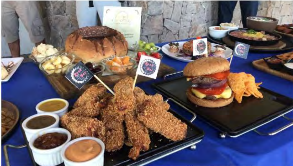
15º Caraguá A Gosto começa neste sábado (1)

Com os estabelecimentos como bares e restaurantes sem autorizações para funcionamento, os pedidos e as notas dos pratos serão feitos pelo aplicativo. Evento vai até 7 de setembro.