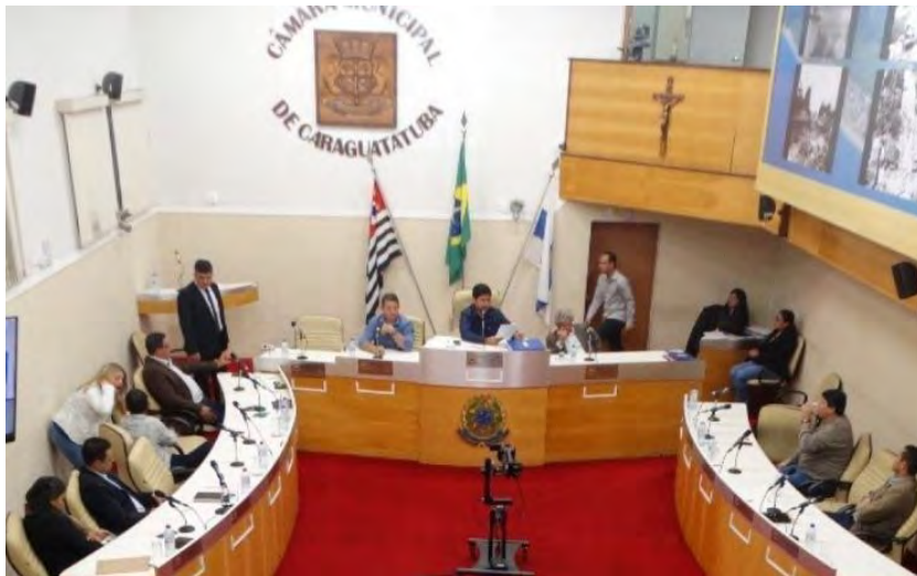
Câmara Municipal de Caraguatatuba

A cidade irá reajustar a alíquota de 11% para 14% na contribuição previdenciária dos servidores municipais somente em setembro