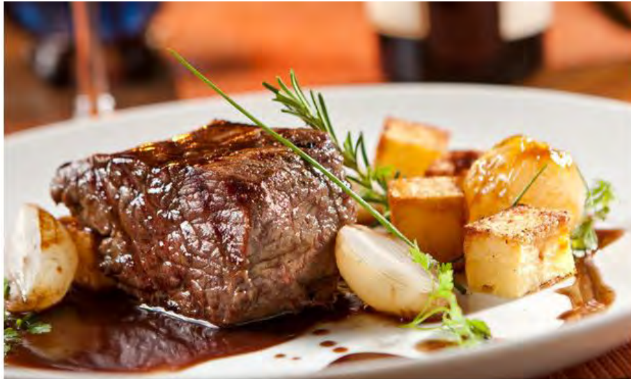
Caraguá a Gosto começa neste sábado

São 50 estabelecimentos e 79 pratos com duas categorias inéditas: gelatos e confeitaria