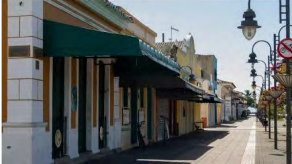
Prefeitura de São Sebastião

Ministério da economia registra mais de mil desempregados no Litoral Norte