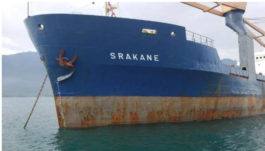
Nove tripulantes ainda aguardam retorno para o país de origem

Tripulação estava barrada com embarcação no litoral, após denúncias de falta de pagamento com dívida de US$ 177 mil. Embarcação foi contratada por empresa brasileira que pagou dívida de salários e valor para repatriação dos trabalhadores estrangeiros.