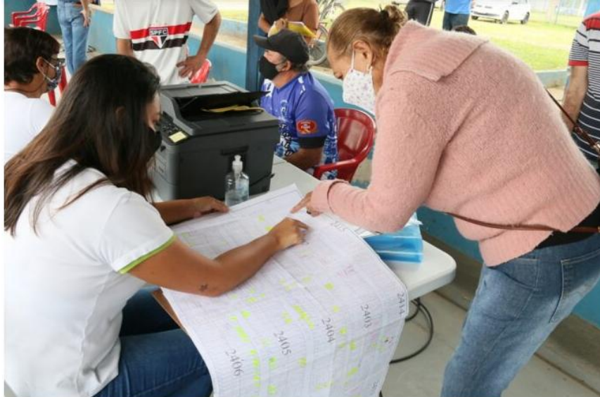
Cadastramento do Rio Marinas ocorreu no sábado

Serão beneficiadas 412 famílias que já fizeram a regularização fundiária