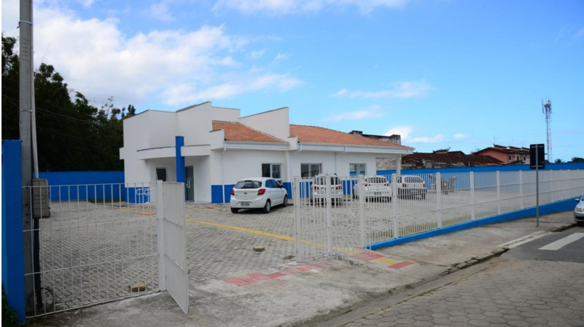
Prefeitura de Caraguatatuba

O prédio novo foi construído pela prefeitura em parceria com o governo federal