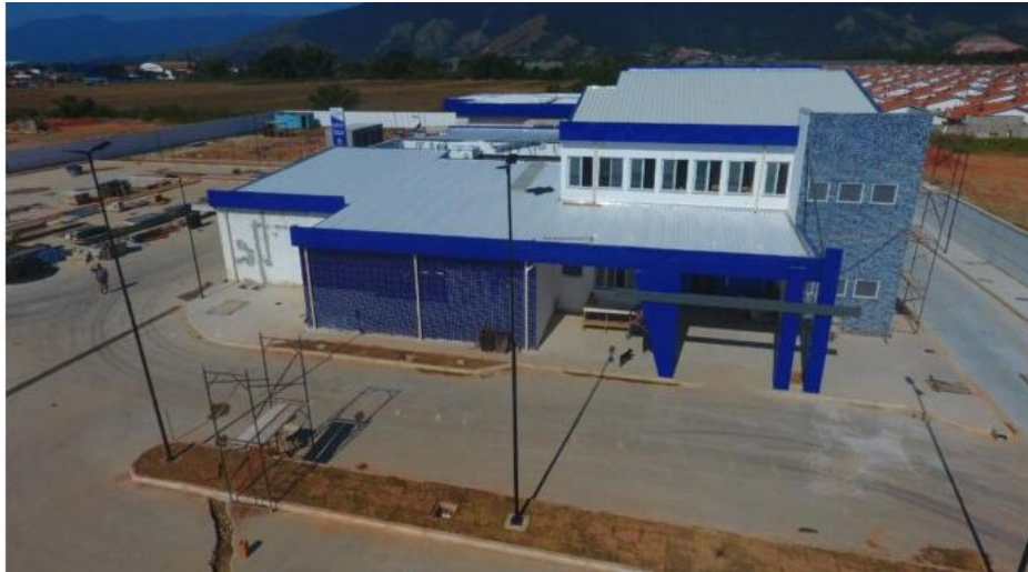
Obras da UPA tiveram início em 2013

Dono da construtora Volpp está preso e negocia delação premiada para reduzir pena