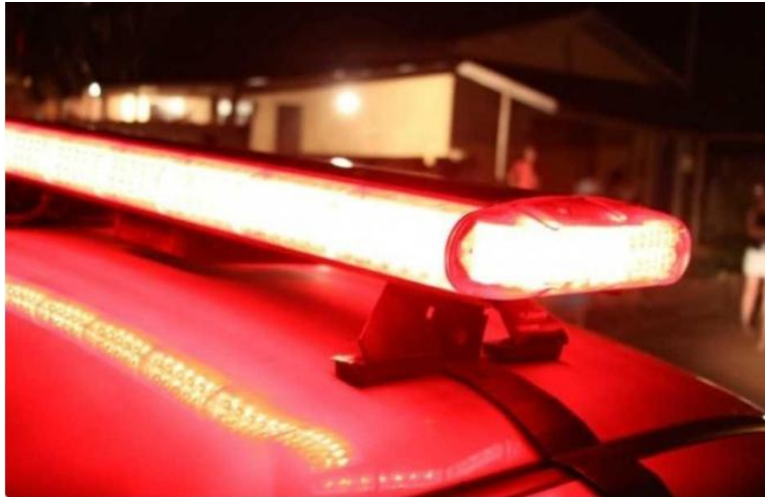
O caso já está sendo investigado pela polícia

As vítimas estavam em uma praça da cidade quando foram surpreendidas pelos criminosos