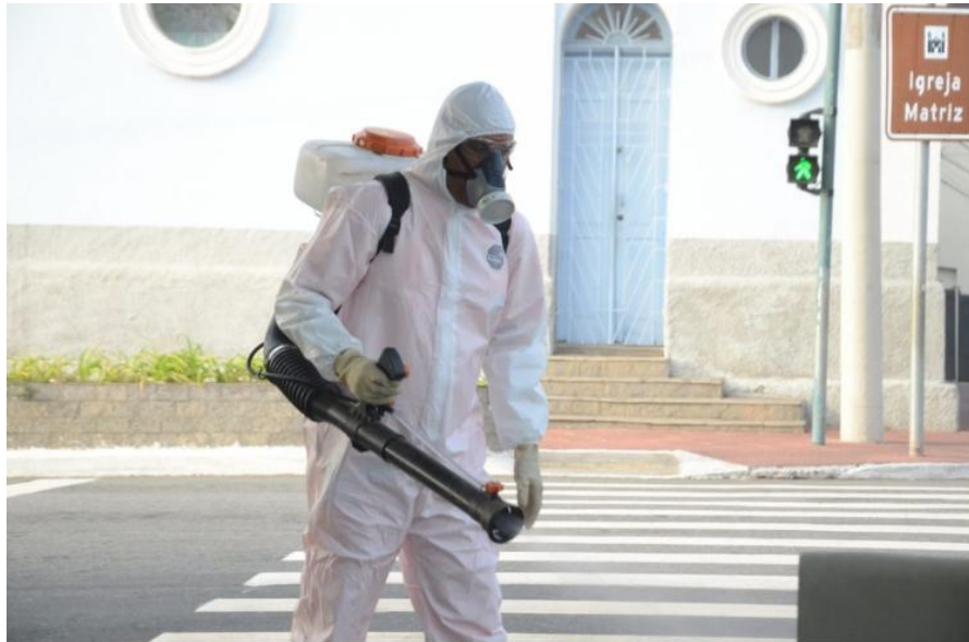
Higienização no centro de São José.

Com o maior número diário de casos confirmados desde o início da pandemia, a RMVale ultrapassou nesta segunda-feira (13) a marca de 10.000 diagnósticos positivos do novo coronavírus.