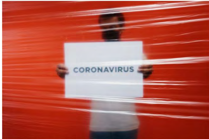
Uma semana de flexibilização, os casos de Covid-19 estão aumentando no Litoral Norte

No período, o número de mortes subiu 120% no Litoral Norte