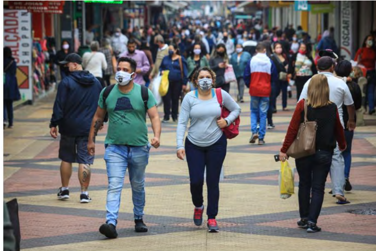
Pandemia em São José

Região atinge 3.133 casos do novo coronavírus apenas 12 dias após atingir 2.000 confirmados; Vale já concentra 127 mortes confirmadas da doença