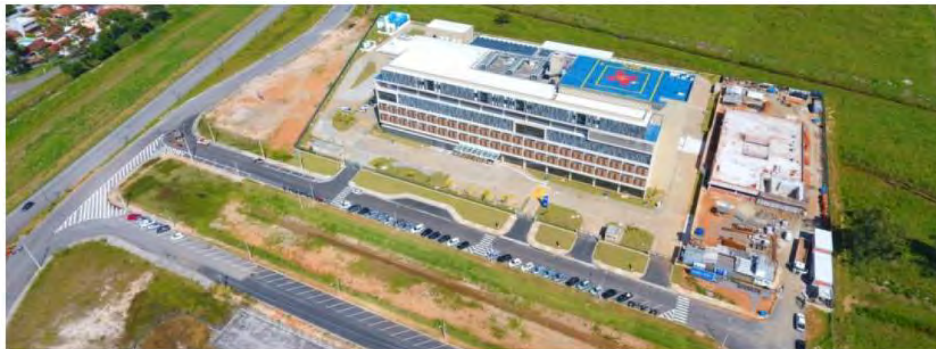
Hospital Regional do Litoral Norte