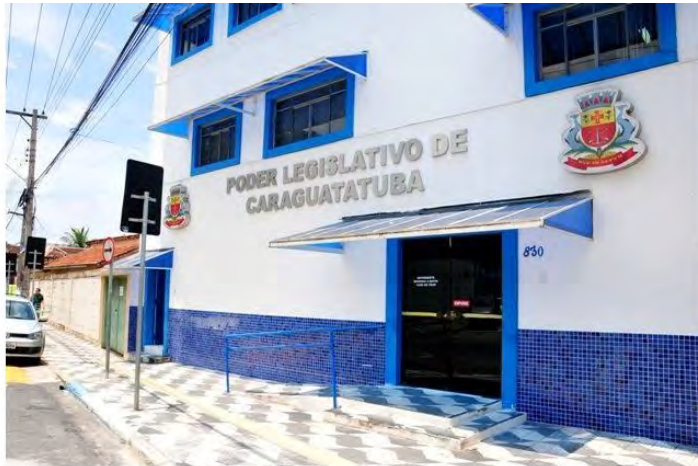
Sistema online segue recomendações de saúde

O orçamento previsto para 2021 é de R$ 857 milhões