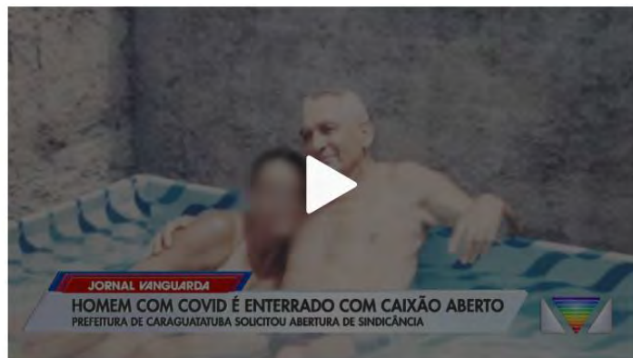
Morador de Caraguatatuba que morreu com Covid-19 é enterrado com caixão aberto

No atestado de óbito consta que a causa da morte foi choque hipovolêmico, que é a perda de uma grande quantidade de sangue que leva à morte, mas não consta que ele tinha coronavírus.