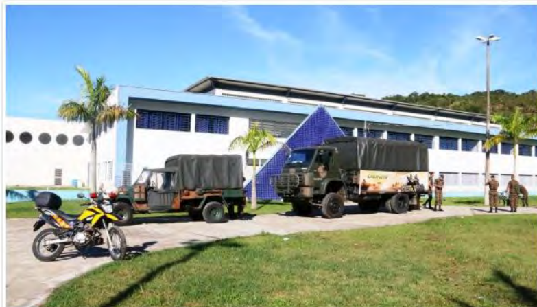
Prefeitura de Caraguatatuba

Mais de 2 mil pessoas ainda não retiraram o benefício