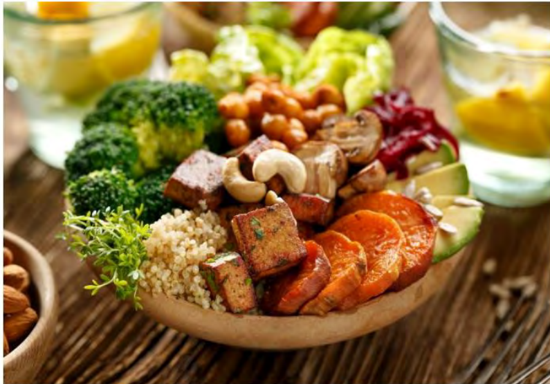
Evento aborda alimentação saudável e sustentabilidade

Programação aborda alimentação saudável, questões ambientais e sociais e cultura e entretenimento Geek