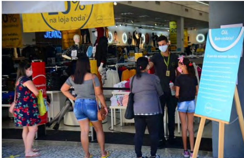
Abertura: Funcionária aplica álcool em gel mão de consumidora na entrada da loja de videogames

Comércios varejistas passam a funcionar das 11h às 17h de segunda a sábado