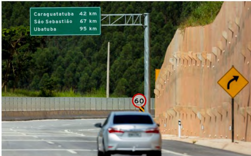
Rodovia dos Tamoios