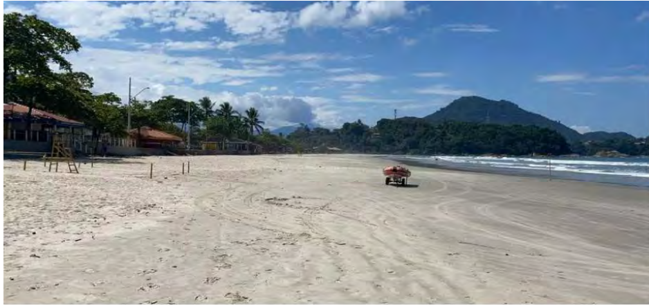
Com mil casos, litoral norte reabre praias e quiosques.

O movimento voltou às praias do litoral norte de São Paulo nesta sexta-feira, 19, quando uma região ultrapassou a marca de mil pessoas infectadas pelo novo coronavírus. Na maioria das cidades, como faixas de areia foram reabertas e os quiosques já estão funcionando. As praias estavam fechadas para banhistas desde o fim de março. Os quatro municípios da região somam 1.003 casos e 36 mortes por vírus. Em um mês, o número de óbitos aumentou 400%, o mesmo com taxas de isolamento acima da média estadual - 53%, ante 46% do Estado nesta sexta-feira.