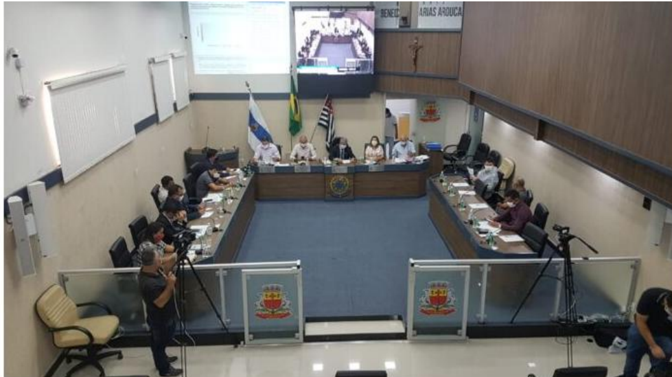
Sessão aconteceu conforme orientações da OMS nesta segunda-feira

Os parlamentares que votaram contra se preocupam com redução dos ganhos de professores e servidores públicos