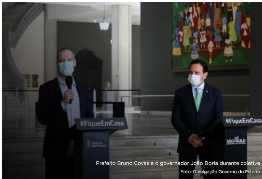
Prefeito Bruno Covas e o governador João Doria durante coletiva