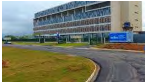
Prefeitura de Caraguatatuba

Prefeito pede mais leitos e restrição de entrada na cidade ao governo estadual