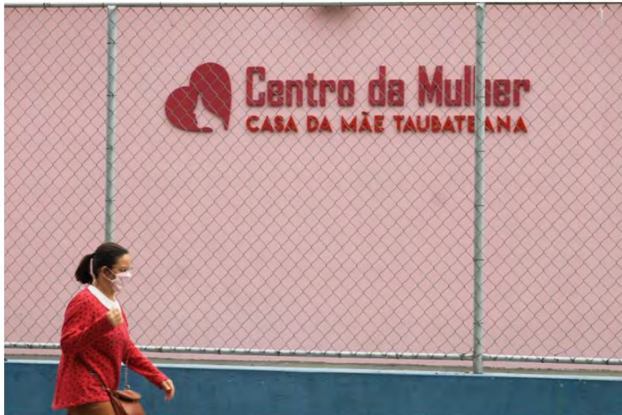
Mulher caminha com máscara de proteção em Taubaté