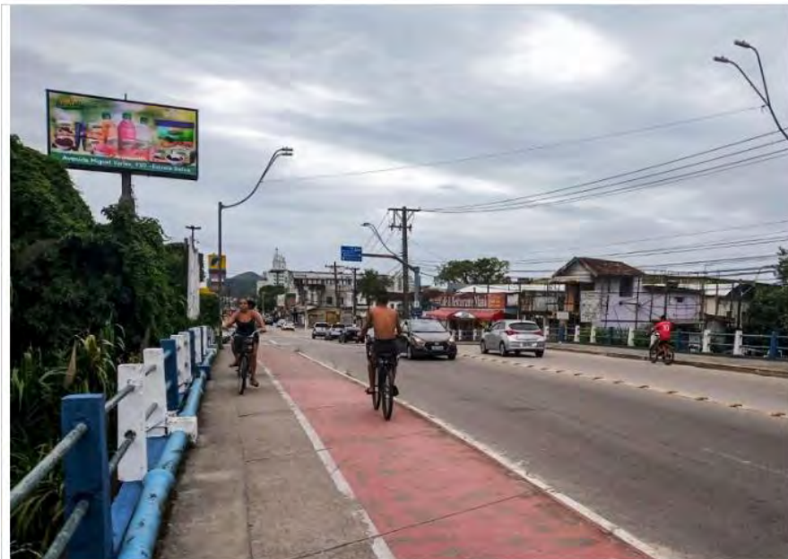
População nas ruas de Caraguatatuba; cidade decreta obrigatoriedade de máscaras

O uso de máscaras de proteção se tornou obrigatório, em Caraguatatuba, com a publicação do decreto municipal, na última quarta-feira (29). A obrigatoriedade entrará em vigor na próxima segunda-feira (4). A ação municipal faz com que seja imprescindível o uso de máscaras (mesmo que artesanais) para funcionários de estabelecimentos comerciais e prestadores de serviços essenciais, e é fundamental para quem trabalha diretamente com atendimento ao público.