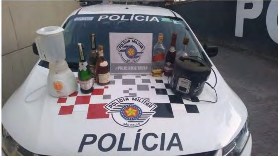
Bebidas e eletrodomésticos foram recuperados pela PM

Em outra ocorrência um casal foi preso com cocaína Jardim Tarumãs