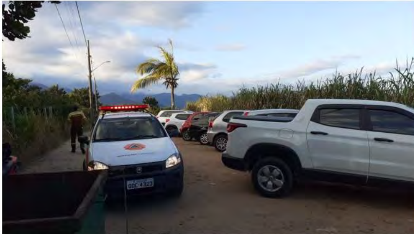
Vários carros estão estacionados em local irregular

Prefeitura proibiu o acesso à praia devido à pandemia da Covid-19