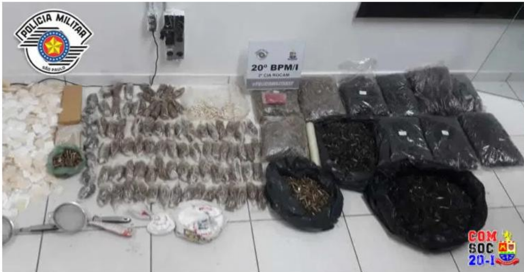
Drogas apreendidas apresentadas no plantão do DP.

No início da noite de terça-feira, dia 7, por volta da 18h40, equipe da Polícia Militar de Caraguatatuba, durante patrulhamento pelo Bairro Rio do Ouro, recebeu denúncia de que havia um local que era usado como venda e armazenamento de drogas.