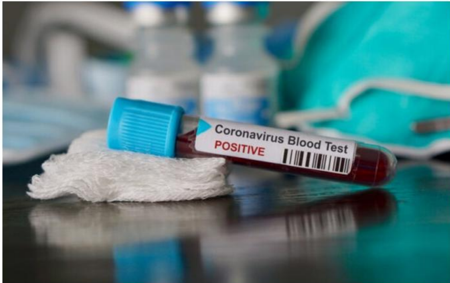
Resultado foi confirmado nesta terça-feira

O Litoral Norte tem hoje 194 casos suspeitos da nova doença