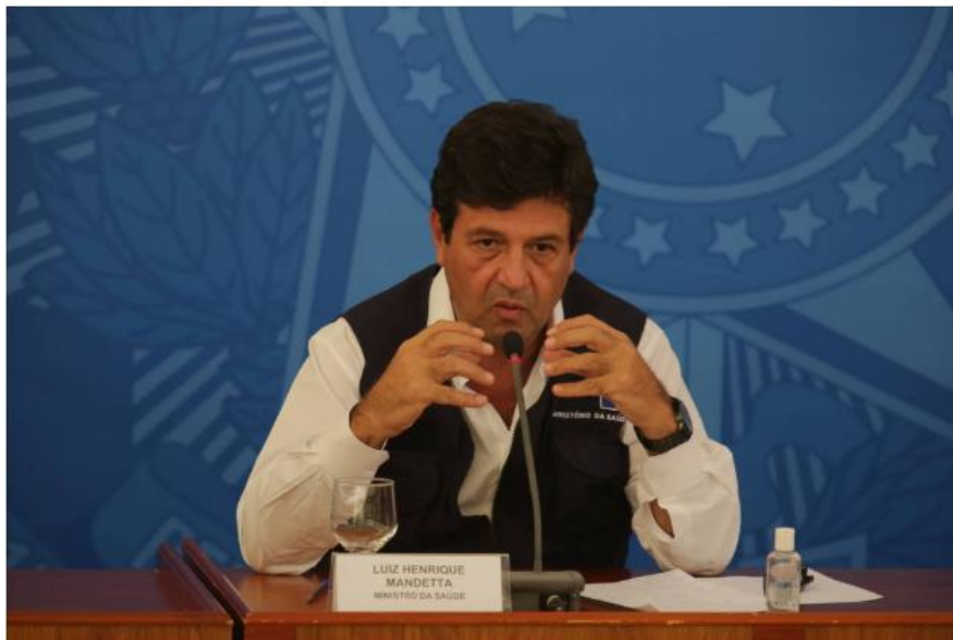
Luiz Henrique Mandetta, ministro da Saúde, durante coletiva sobre combate ao coronavírus