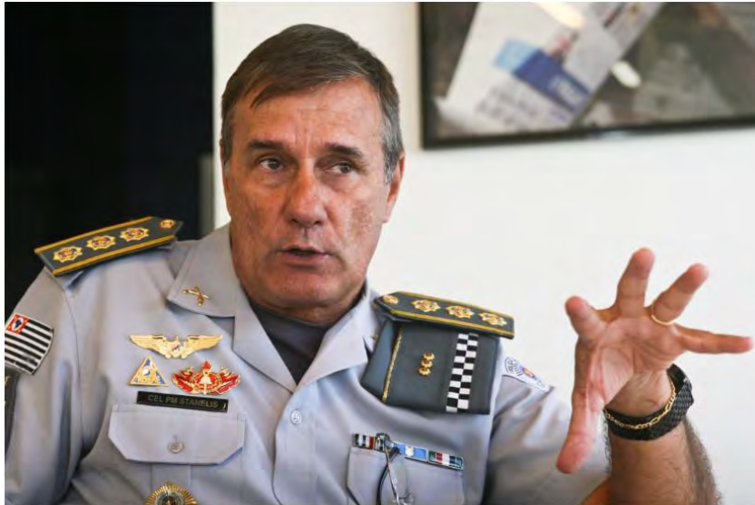
De saída. Coronel se despede