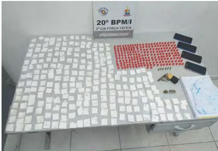
Com ela foram encontradas diversas drogas, além de uma arma de fogo

Com ela foram encontradas uma arma, além de papelotes de cocaína, maconha e crack.