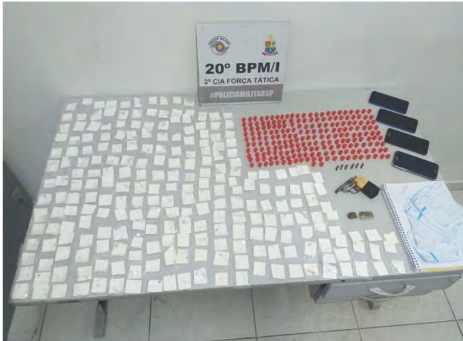
Drogas e celulares apreendidos apresentados no DP.

No início da madrugada desta quinta-feira, dia 5, equipe de Força Tática da Polícia Militar de Caraguatatuba, durante patrulhamento pelo bairro Estrela D'alva avistou um adolescente saindo correndo de uma residência, motivo que levantou suspeita e motivou a abordagem. Em busca pessoal com o adolescente foram encontrados 15 papelotes de cocaína. Indagado, ele confessou estar levando a droga para abastecer um ponto de tráfico no bairro Benfica.