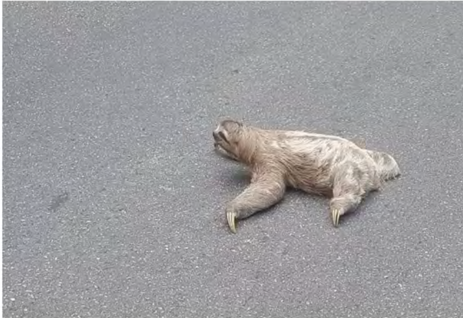
Bicho-preguiça para a serra em Caraguatatuba — Foto: Raul Araújo/ Vanguarda Repórter