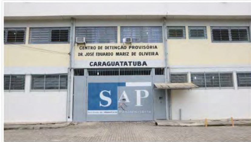
Centro de Detenção de Caraguatatuba

Companheiras de detentos tentaram entrar com drogas no Centro de Detenção