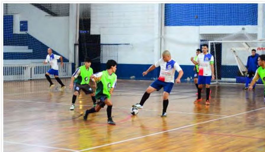
Prefeitura de Caraguatatuba

Chamada dos projetos selecionados pelo Fundo de Incentivo ao Desporto Amador