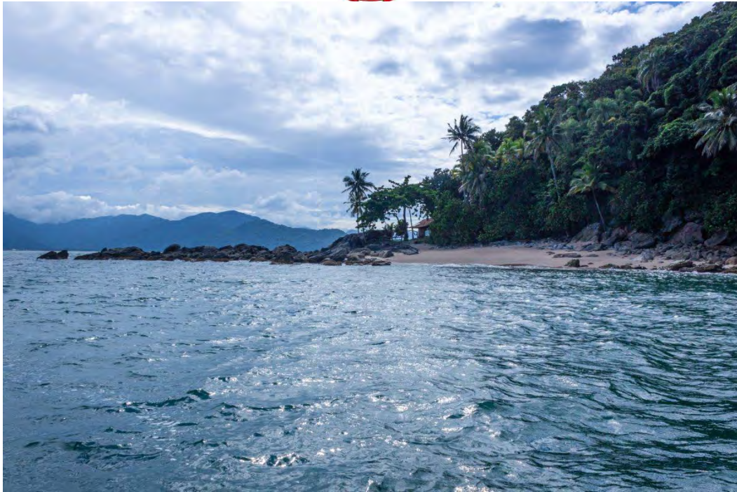
Ilha dos gatos