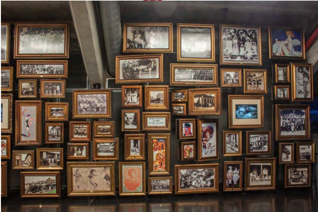
Museu do Futebol

Enfin, nous avons conclu notre journée avec l'avenue Paulista , une des plus grandes et célèbres avenues de la ville de São Paulo. Elle représente le quartier d'affaires, là où vivent et travaillent les gens plus riches.