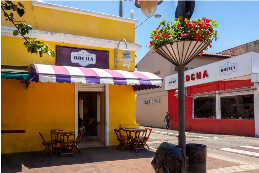
Quelques bâtiments de la ville de São Sebastião