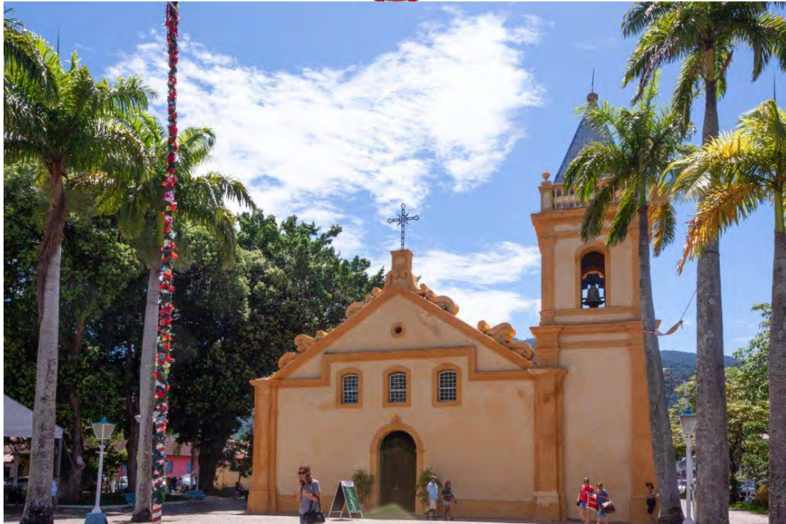
L'église Igreja Matriz de São Sebastião

Une anecdote m'interpelle. Le guide explique que certaines maisons de riches étaient construites avec des fausses fenêtres (voir ci-dessous). Pourquoi ? Pour éviter que les personnes plus pauvres ne voient et n'écourent ce qu'il se passait à l'intérieur et n'apprennent des potins faciles à divulguer au reste au village.