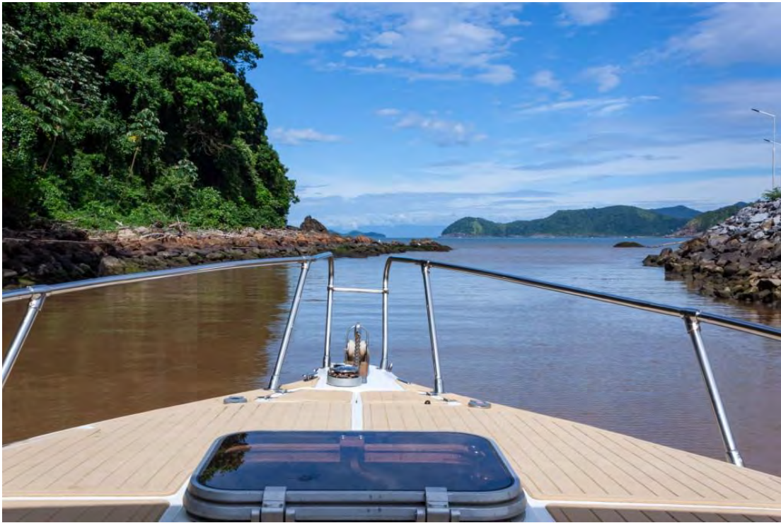
Tour des îles en bateau, São Sebastião

Le lendemain matin, j'ai eu la chance de partir en bateau, en plein cœur de l'océan Atlantique pour profiter pleinement des îles de São Sebastião que l'on nomme tout simplement As Ilhas .