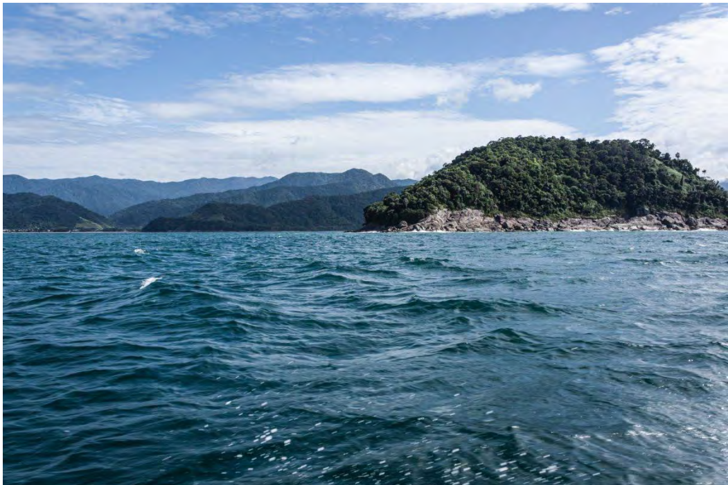
Une multitude de montagne entoure l'océan

De retour sur la terre ferme, je participe ensuite à une visite guidée de la ville. Les couleurs vives m'enchantent.