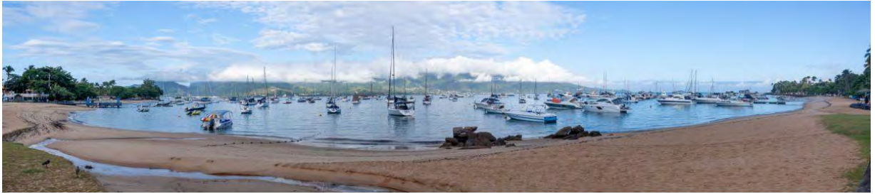
Au bord de l'eau, Ilhabela

shirt et souliers ouverts, loin de la grande ville. Plusieurs bateaux se trouvent au bord de l'eau et au matin, il n'y a pas un chat sur la plage.