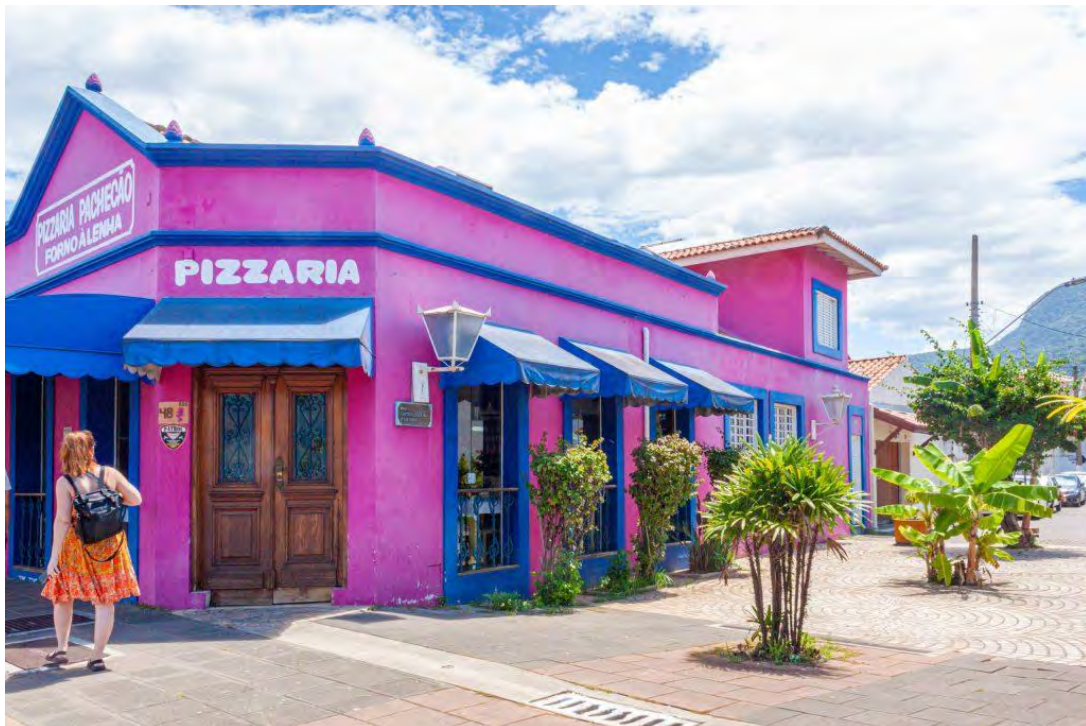
Une pizzeria à São Sebastião