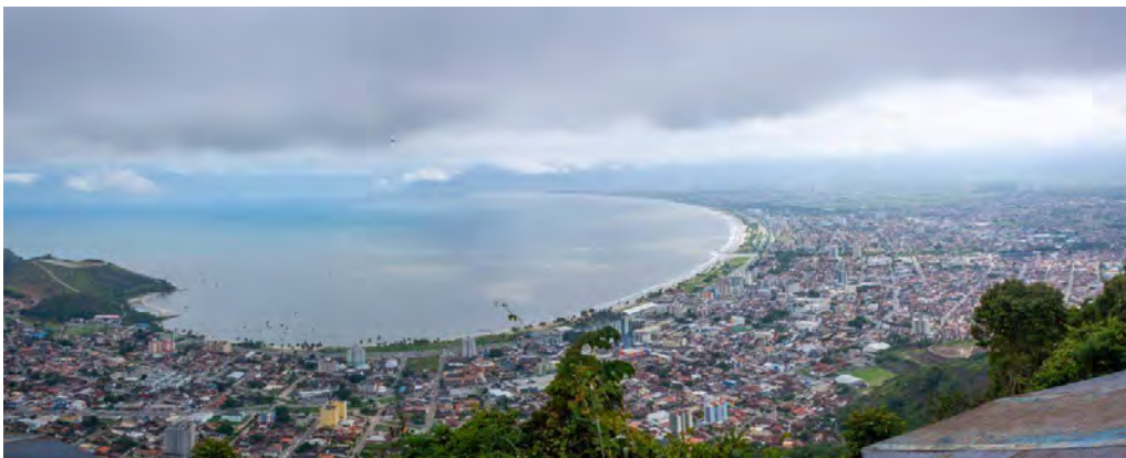
Morro de Santo Antônio

Après la plage, le sommet où se trouve la statue de Saint Antoine. Pour les plus courageux, il est possible de monter en 30 minutes jusqu'en haut mais il vaut mieux être préparé car avec ses 340 mètres d'altitude, la pente est très rude. Pour les moins ambitieux, il est possible d'y aller en auto, mais assurez-vous qu'elle ait de bons freins ! Quel que soit le moyen de transport, la vue une fois en haut est incroyable. On y voit le mélange entre nature, urbanisme et plage.