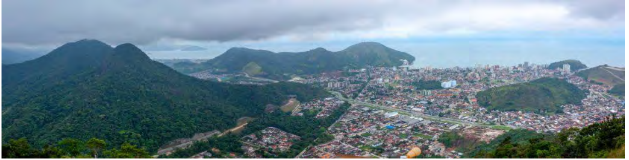
Une autre vue, à quelques mètres de la statue de Santo Antônio