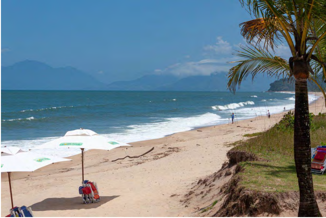
Praia do Massaguaçu, plage connue pour son championnat mondial de pêche

Après la plage, le sommet où se trouve la statue de Saint Antoine. Pour les plus courageux, il est possible de monter en 30 minutes jusqu'en haut mais il vaut mieux être préparé car avec ses 340 mètres d'altitude, la pente est très rude. Pour les moins ambitieux, il est possible d'y aller en auto, mais assurez-vous qu'elle ait de bons freins ! Quel que soit le moyen de transport, la vue une fois en haut est incroyable. On y voit le mélange entre nature, urbanisme et plage.