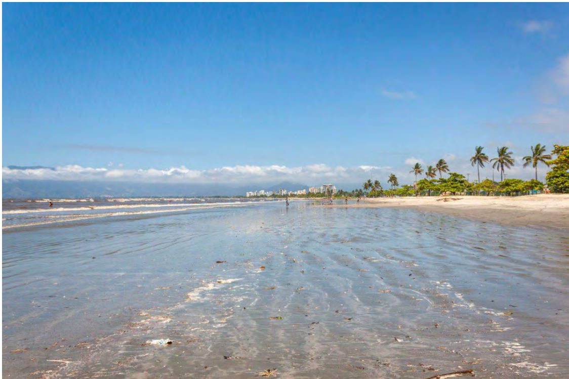
Praia do Centro

Après cette courte escapade, nous repartons, cette fois-ci pour Caraguatatuba, une ville située à 1h30 d'Ilhabela. Plus de 100 000 personnes vivent dans cette région qui compte plus de 17 plages.