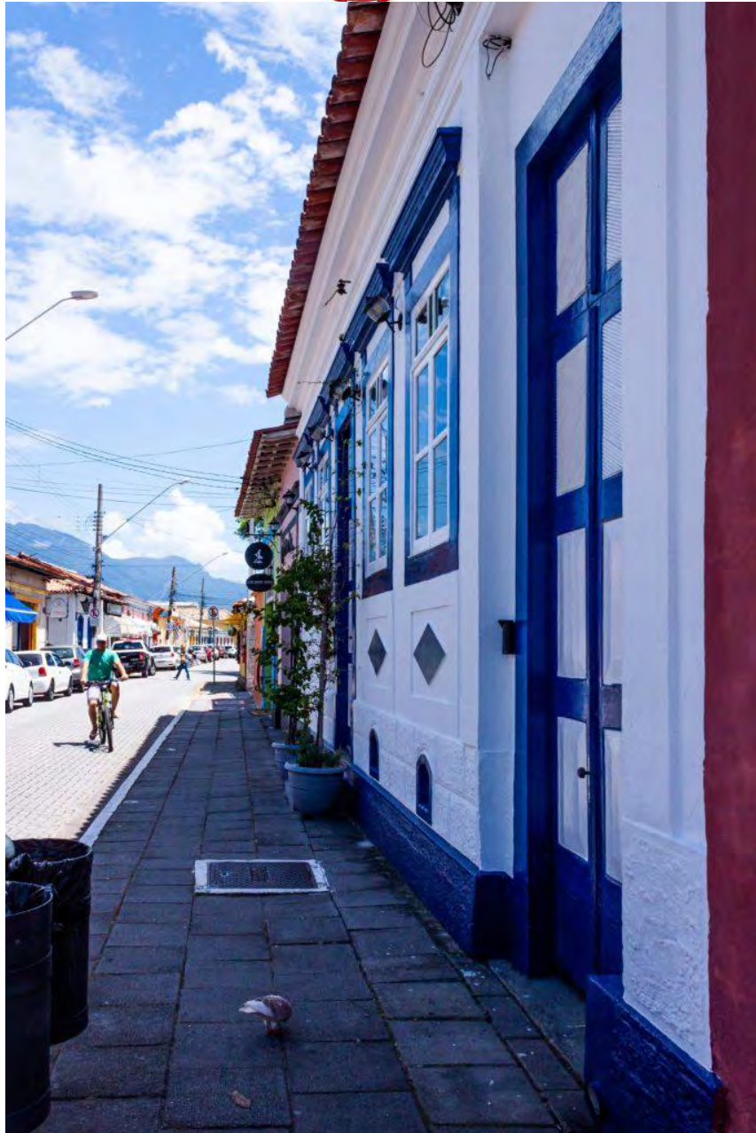
La maison des fenêtres