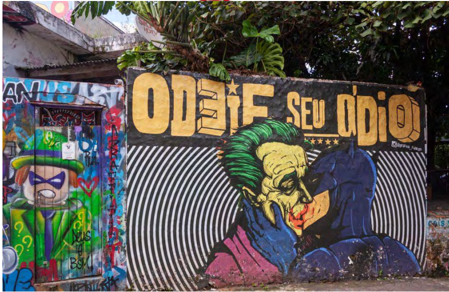
Beco do Batman

Nous avons ensuite continué vers le musée du football, inauguré en 2008. À travers les photographies, les trophées, les vidéos mais aussi les anecdotes et l'histoire, on y découvre tout un monde dédié au sport national du pays dans un musée très moderne.