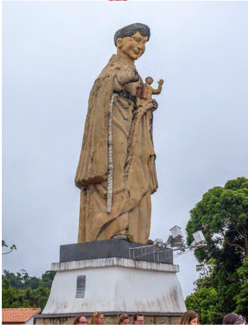
Statue de Santo Antônio