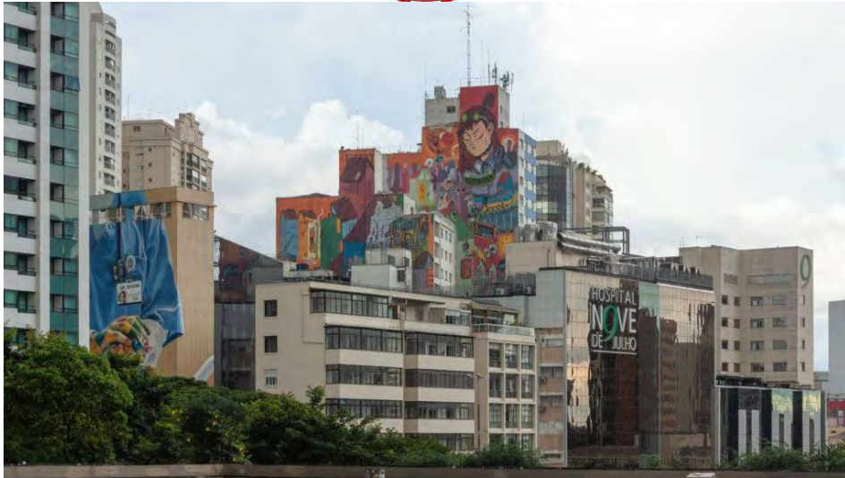
monde. Vue urbaine