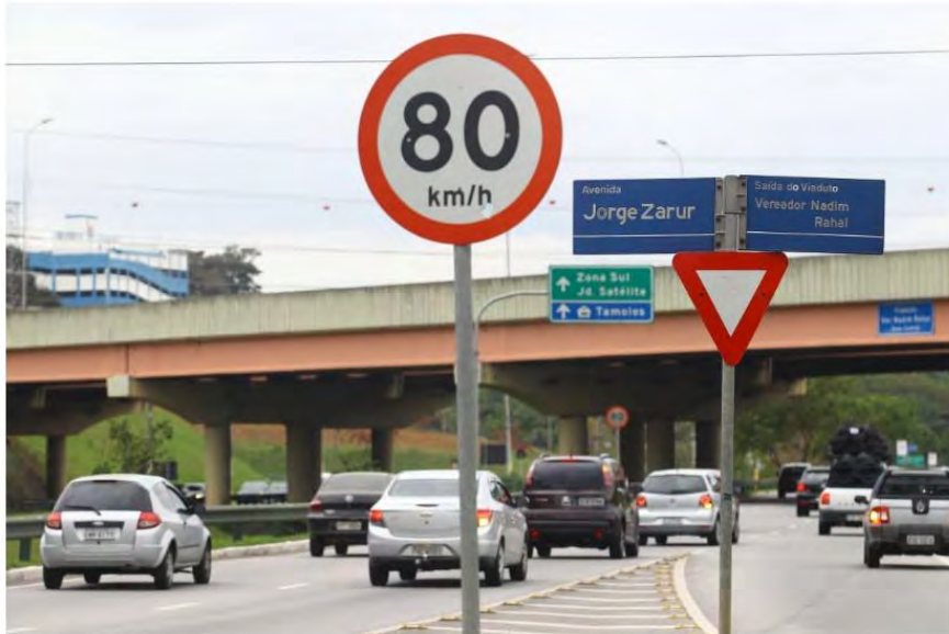
Verde. A letalidade caiu no Vale

Em janeiro do ano passado, a região registrou 23 mortes em acidentes de trânsito; nos demais anos anteriores, o número de mortes no primeiro mês também foi superior ao deste ano: 36 (2018), 31 (2017), 25 (2016) e 37 (2015)