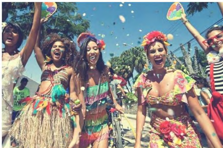
Litoral Norte espera 600 mil foliões durante o feriado

O diretor em Caraguatatuba dá dicas sobre diversos cuidados para evitar prejuízos neste feriado