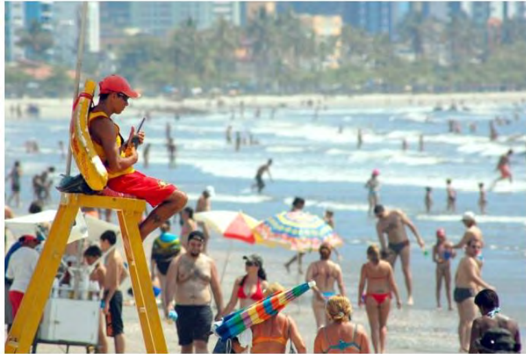
Guarda-vidas na praia do Indaiá

A cidade terá mais de 50 profissionais para atender emergências na orla